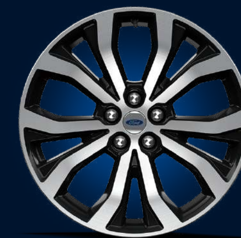
Rines de Aluminio Maquinado de 20 Pulgadas (ST)