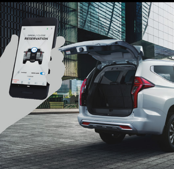
MITSUBISHI REMOTE CONTROL