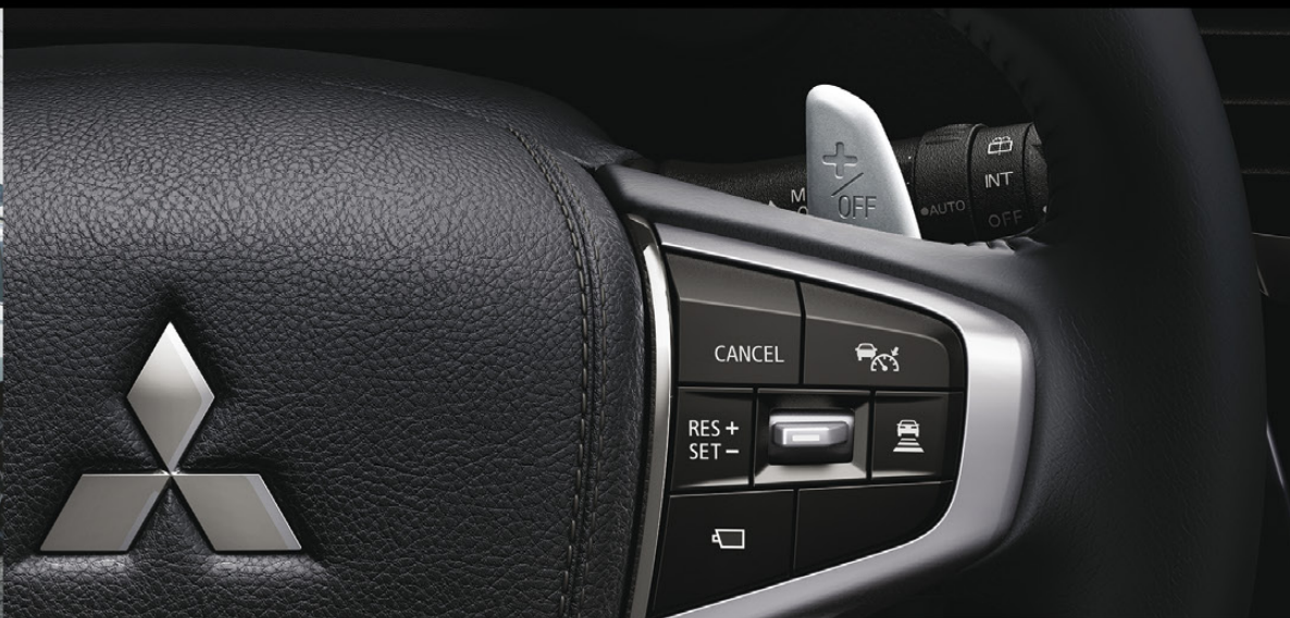
CONTROLES AL VOLANTE