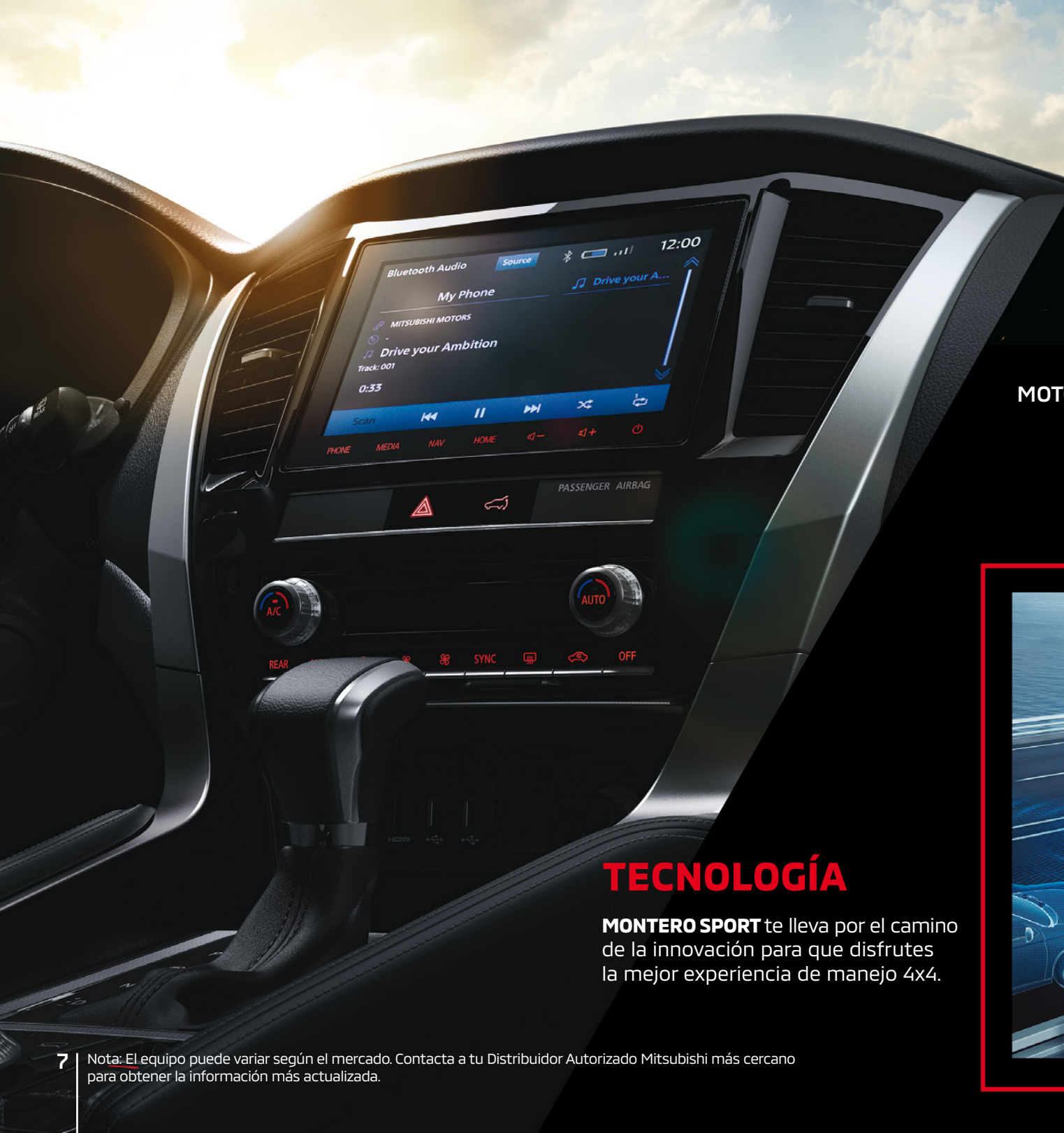
MOTOR V6 MIVEC 3.0 L