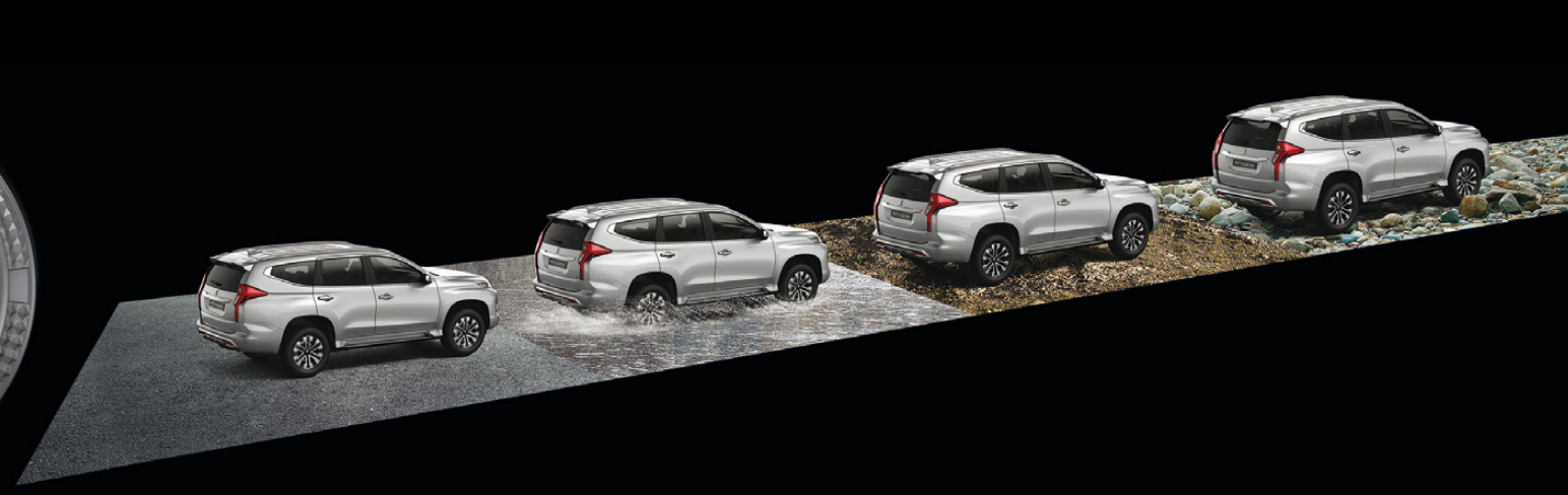
2H Para condiciones normales.