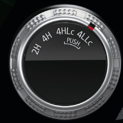
SUPER SELECT 4WD-II