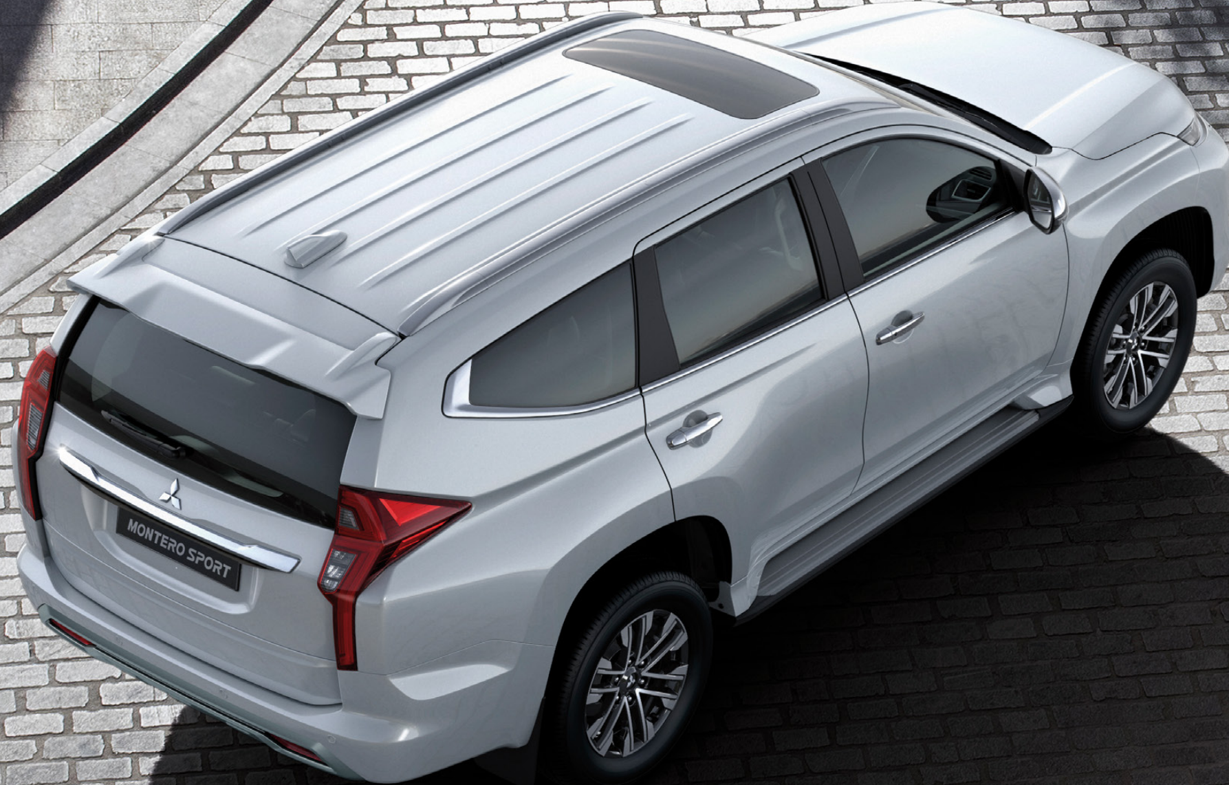
9 MONTERO SPORT SE+ Color White Solid Nota: El equipo puede variar según el mercado. Contacta a tu Distribuidor Autorizado Mitsubishi más cercano para obtener la información más actualizada.