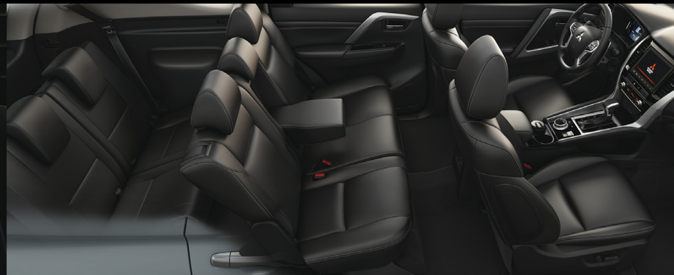
TRES FILAS DE ASIENTOS