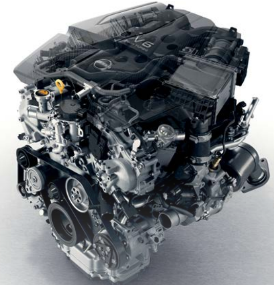
Motor V6 Twin-Turbo de 3.0 litros, 400hp y 350 Lb-pie de torque

Nissan Z cuenta con nuevos amortiguadores monotubo, una nueva geometría delantera, Frenos Akebono (R) de 4 pistones y puesta a punto de la suspensión trasera pensados para ofrecer una experiencia de manejo sobresaliente. La dirección asistida eléctrica permite mejor maniobrabilidad para un control y una precisión excepcionales.