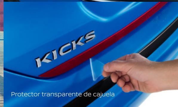
Protector transparente de cajuela