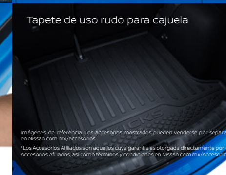
Tapete de uso rudo para cajuela