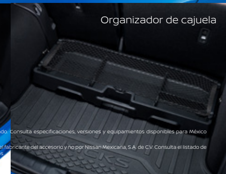
Organizador de cajuela

Imágenes de referencia. Los accesorios mostrados pueden venderse por separado y podrán diferir ligeramente de los que figuran en este material. Consulta versiones y equipamientos disponibles para México en Nissan.com.mx/accesorios