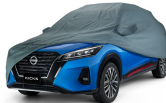
Cubierta de vehículo

Personaliza tu Nissan Kicks con nuestra línea de Accesorios.