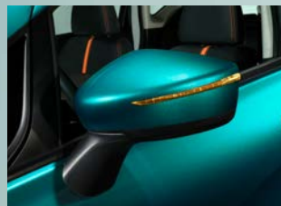
Espejos abatibles con luz direccional integrada (Versión SR)