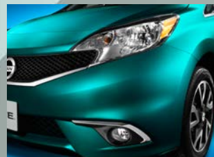
Faros de halógeno y de niebla