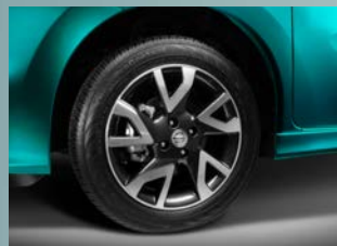
Rines deportivos de aluminio de 16" con acabado ahumado (Versión SR)