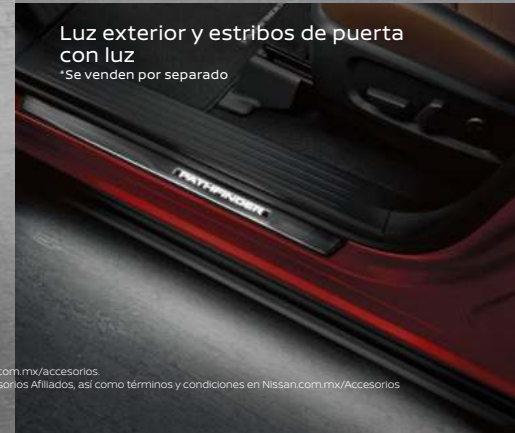
Luz exterior y estribos de puerta con luz *Se venden por separado

Imágenes de referencia. Los accesorios mostrados pueden venderse por separado. Consulta especificaciones, versiones y equipamientos disponibles para México en Nissan.com.mx/accesorios. *Los Accesorios Afiliados son aquellos cuya garantía es otorgada directamente por el fabricante del accesorio y no por Nissan Mexicana, S.A. de C.V. Consulta el listado de Accesorios Afiliados, así como términos y condiciones en Nissan.com.mx/Accesorios