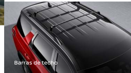
Barras de techo

Haz tuya la línea de accesorios para Nissan Pathfinder