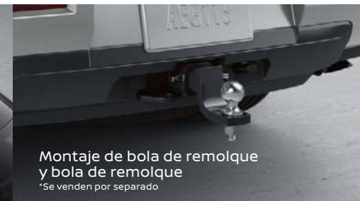
Montaje de bola de remolque y bola de remolque *Se venden por separado