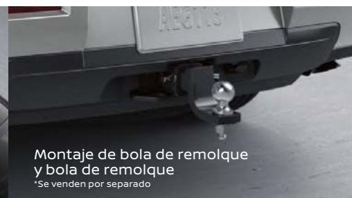
Montaje de bola de remolque y bola de remolque