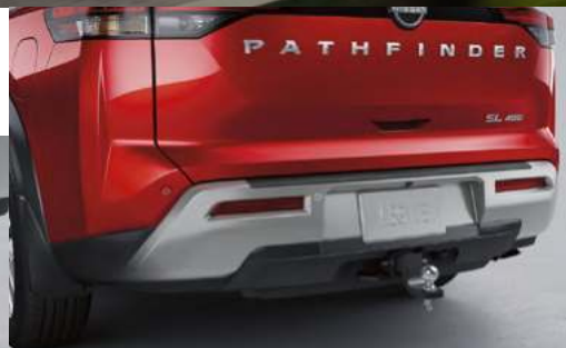
Loderas frontales y traseras