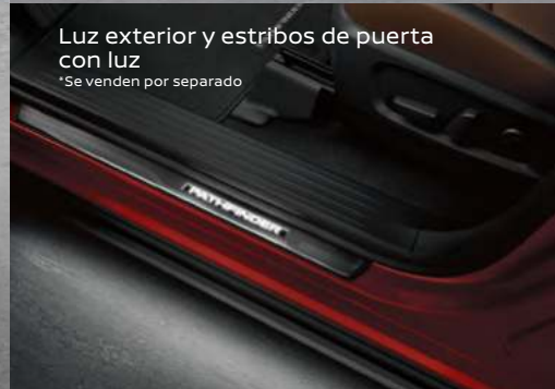
Luz exterior y estribos de puerta con luz