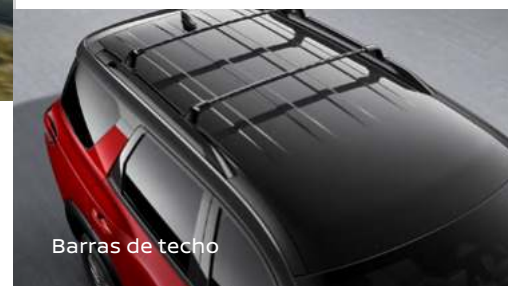
Barras de techo

Haz tuya la línea de accesorios para Nissan Pathfinder