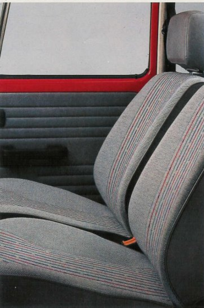
Espacioso habitáculo. Asientos anatómicos individuales.