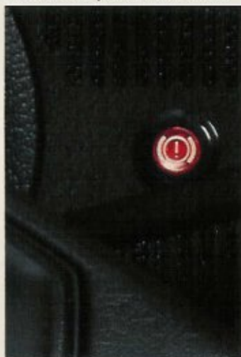
Indicador de presión de frenos.