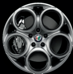
1MA - 18" Silver