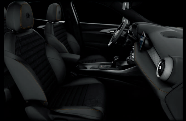
Zwarte stof met gele stiksels (Ti)