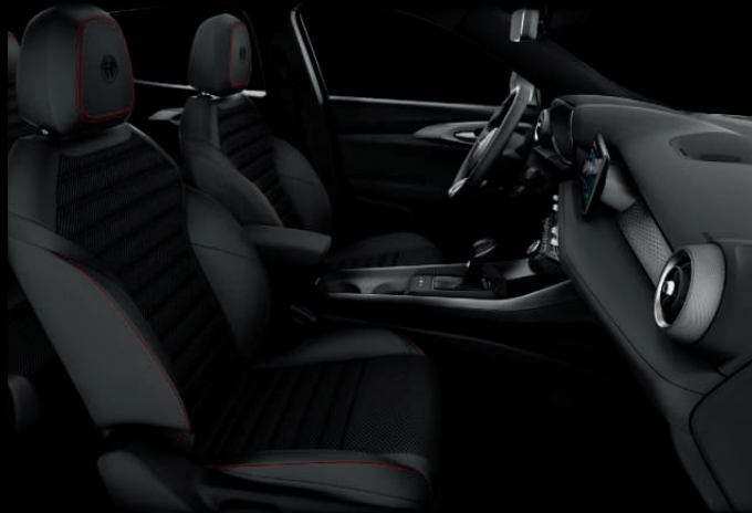
Zwarte stof met rode stiksels (Sprint)