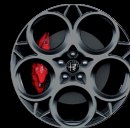
1M4 - 20" Graphite Grey