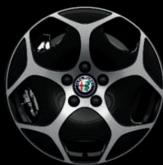
WAC - 17" Diamond Dark