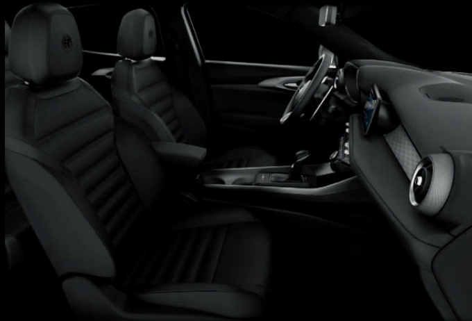
Geperforeerd zwart lederen bekleding met grijze stiksels (optie 211)