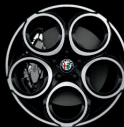
WBR - 18" Diamond Cut Dark