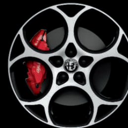
1MM - 19" Diamond Cut Dark