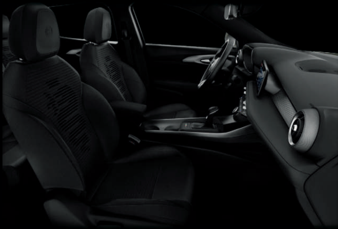
Zwarte stof met Biscione logo (Super)