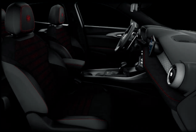
Alcantara bekleding zwart met rode en grijze stiksels (Veloce)