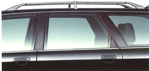
De verchromde dakreling vormt een ideale bevestiging voor diverse draagsteunen.