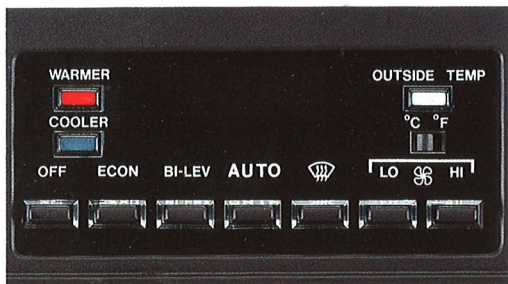
Thermostatisch geregelde airconditioning met geheel automatische werking.