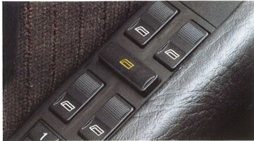
Paneel voor elektrisch bedienbare zijruiten in de armsteun van het bestuurdersportier.

De standaard extra's van de Audi 100 CD. De luxueuze binnen- en buitenuitrusting omvat niet alleen aangename details als eerste klas veloursbekleding, elektrisch bedienbare zijruiten voor en achter, centrale portiervergrendeling, thermostatisch geregelde airconditioning, verlichte make-up spiegel rechts en binnenverlichting met vertragingmechanisme, maar ook een opbergmogelijkheid aan de rugleuning van de voorstoelen, open hoofdsteunen en een automatische heupgordel op de achterbank.