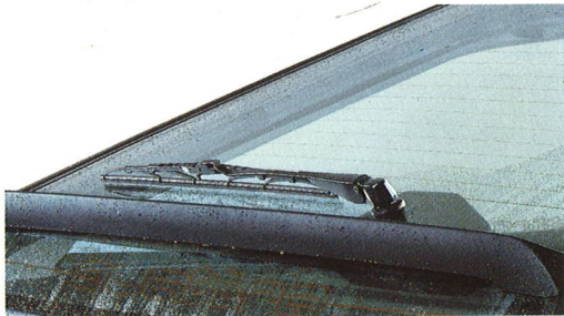
Achterraitewisser en -sproeier met interval.