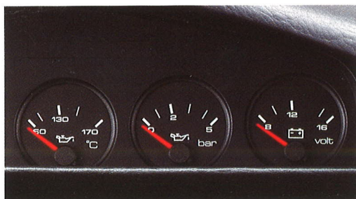
Extra instrumenten in het dashboard; Voltmeter, oliedruk- en olietemperatuurmeter (benzine-motoren).