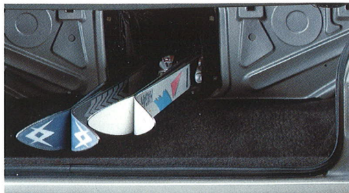
De doorlaadmogelijkheid opent ideale mogelijkheden, en niet alleen voor het vervoer van ski's (limousine).

Daarbij komen nog extra instrumenten (benzinemotoren), een doorlaadmogelijkheid voor lange voorwerpen (limousine), drie leeslampjes en een auto-check systeem, evenals houtbekleding op dashboard en portieren. Eveneens standaard zijn de chroomlijsten, lichtmetalen wielen en de in wagenkleur uitgevoerde portiergrepen.