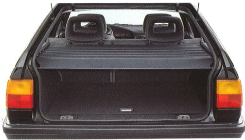
De bagageruimte-afdekking is met één hand te bedienen en biedt optimale bescherming tegen nieuwsgierige blikken.

Zo heeft de Audi 100 Avant CD een bagageruimte-afdekking die beschermt tegen nieuwsgierige blikken, een achterraitewisser en -sproeier met interval, een stijlvolle dakreling evenals een elektronische dakantenne.