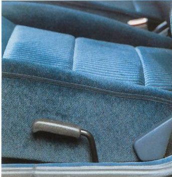
In hoogte verstelbare bestuurdersstoel.