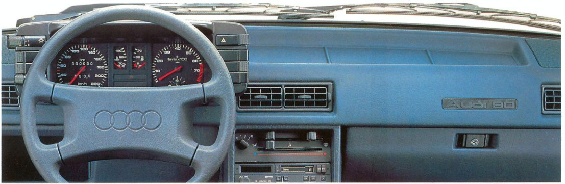
Stuurbechrchtiging en een compleet dashboard met toerenteller.