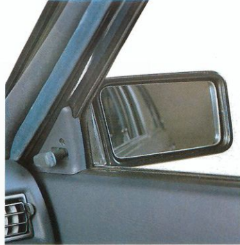
Van binnenuit te bedienen buitenspiegels.