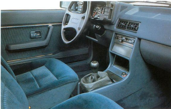
Luxe velours bekleding.