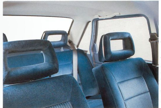
Hoofdsteunen voor en achter.