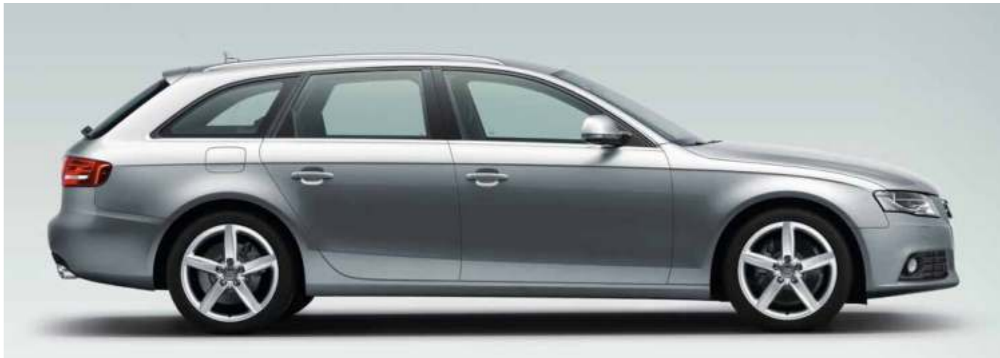
Audi A4 Avant in quartzgrijs metallic met gegoten lichtmetalen velgen in 5-spaak ster design. Uitrusting: elektrisch verstelbare sportstoelen, leder Valcona mustangbruin, dashboard zwart, interieurlijsten wortelnotenhout bruin, dvd-navigatiesysteem met MMI en Audi Soundsystem.