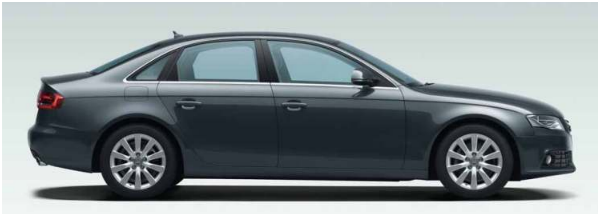
Audi A4 in meteorgrijs pareleffect met gegoten lichtmetalen velgen in 10-spaak ster design. Uitrusting: comfortstoelen met klimaatregeling, leder Milano kardamombeige, dashboard tarabeige, interieurlijsten laurelhout muskaatbruin, dvd-navigatiesysteem met MMI, Bang & Olufsen Sound System.