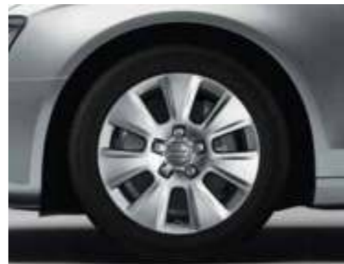
Gegoten lichtmetalen velgen in 7-arm parabool design Maat 7,5 J x 17, banden 225/50 R 17