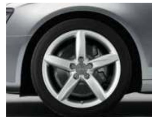
Niet voor Nederland (velgen met winterbanden zijn niet af fabriek leverbaar, wel als dealeroptie)