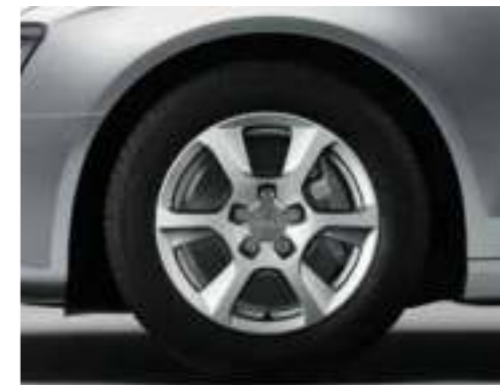
Niet voor Nederland (velgen met winterbanden zijn niet af fabriek leverbaar, wel als dealeroptie)