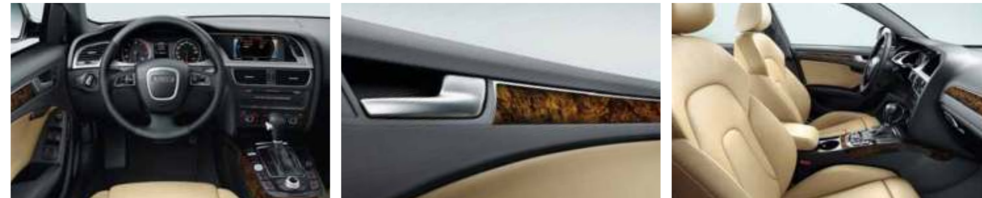
Audi A4 Avant in lavagrijs pareleffect met gegoten lichtmetalen velgen in 10-spaak ster design. Uitrusting: elektrisch verstelbare sportstoelen met geheugenfunctie, leder Valcona luxorbeige, dashboard zwart, interieurlijsten laurelhout muskaatbruin, dvd-navigatiesysteem met MMI en Bang & Olufsen Sound System.