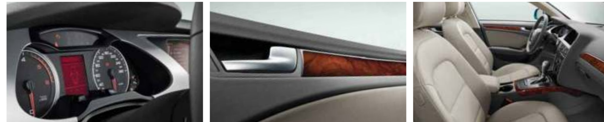
Audi A4 in arubablauw pareleffect met gegoten lichtmetalen velgen in 6-spaak design. Uitrusting: standaard stoelen, stof Arkana lichtgrijs, dashboard grafietgrijs, interieurlijsten wortelnotenhouit bruin, radio Symphony met Audi Soundsystem.