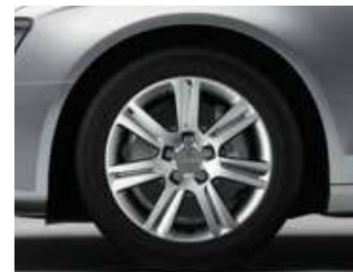
Niet voor Nederland (velgen met winterbanden zijn niet af fabriek leverbaar, wel als dealeroptie)