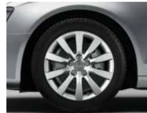
Gegoten lichtmetalen velgen in 10-spaak ster design Maat 8 J x 17, banden 245/45 R 17; naar keuze velgen met banden met noodloopeigenschappen, maat 8 J x 17, banden 245/45 R 17