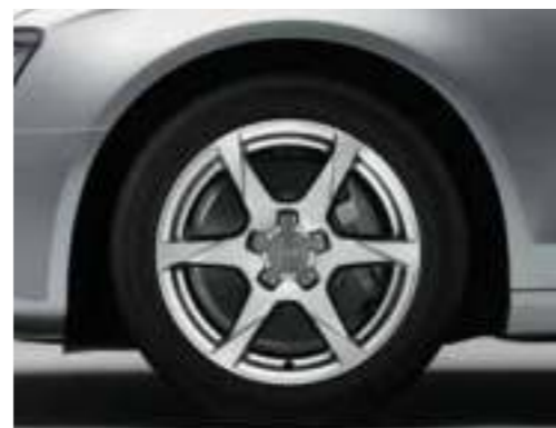
Gegoten lichtmetalen velgen in 6-spaak design Maat 7,5 J x 17, banden 225/50 R 17