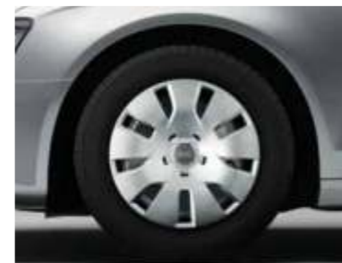
Niet voor Nederland (velgen met winterbanden zijn niet af fabriek leverbaar, wel als dealeroptie)