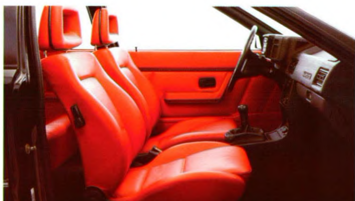
Lederen uitvoering - kleur door cliënt te bepalen