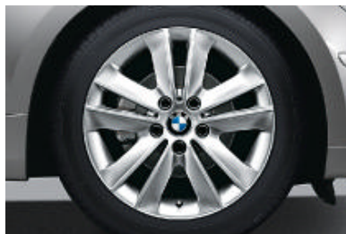
Lichtmetalen BMW wielen in V-spaak styling 141 met noodloopeigenschappen, 7 J x 17 inch, bandenmaat 205/50 R 17.