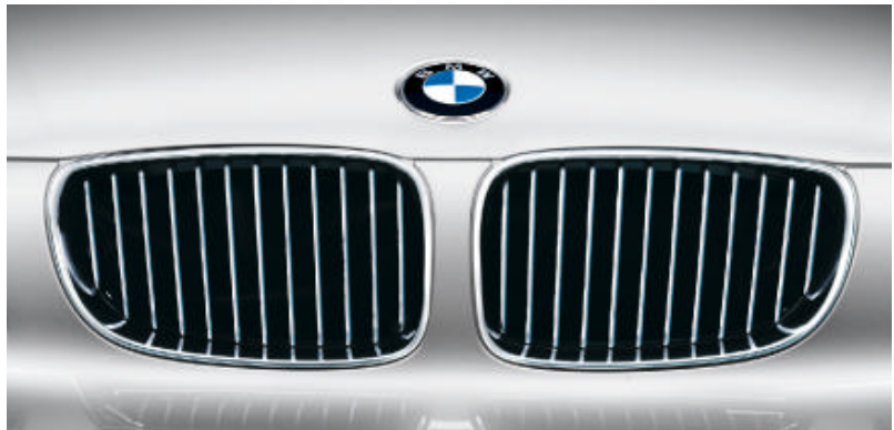
De grille van de 130i is voorzien van een verchromde omlijsting en verchromde spijlen.

De 130i onderscheidt zich door subtiele details. Uiterlijk door de 17-inch lichtmetalen BMW wielen in sterspaak styling 256 met noodloopeigenschappen, de grille met verchromde spijlen en de dubbele uitlaat met verchromde eindpijpen. Het met leder beklede sportstuur en het aangepaste instrumentenpaneel verlenen het interieur van de 130i een bijzonder dynamisch accent. De 130i is verder standaard uitgerust met in chroom uitgevoerde dorpellijsten (5-deurs ook achter), airconditioning en bekleding in stof Network.