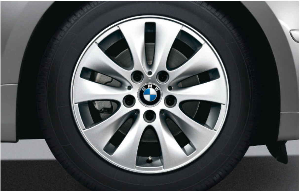
Lichtmetalen BMW wielen in V-spaak styling 229 met noodloopeigenschappen, 6,5 J x 16 inch, bandenmaat 195/55 R 16 (op 116i, 118i en 118d); 7 J x 16 inch, bandenmaat 205/55 R 16 (op 120i en 120d).

Voor de standaard- en extra-uitrusting verwijzen wij naar de uitrustings tabellen.