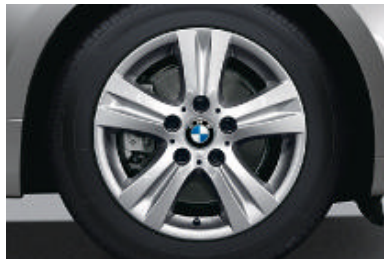
Lichtmetalen BMW wielen in dubbelspaak styling 222 met noodloopeigenschappen, 7 J x 16 inch, bandenmaat 205/55 R 16.