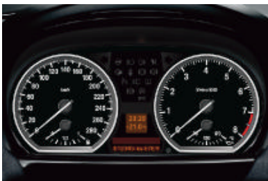
Het instrumentenpaneel van de BMW 130i is voorzien van een op de prestaties afgestemde calibrering. Daarnaast beschikt de 130i over een olietemperatuurmeter.