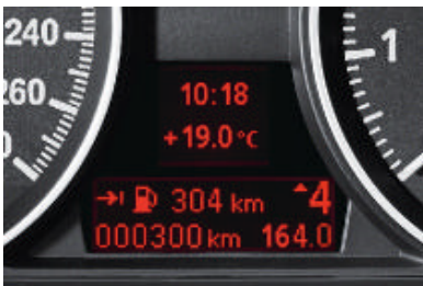
Boordcomputer, informeert u over gemiddelde snelheid, gemiddeld en actueel verbruik, actieradius en buitentemperatuur.