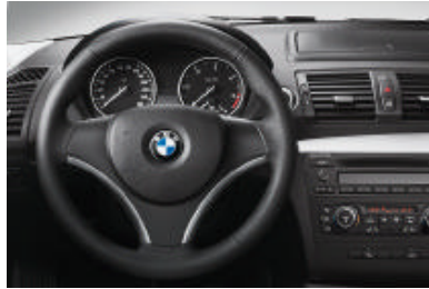
Met leder bekleed sportstuur (diameter 369 mm), driespaaks. Ook leverbaar in combinatie met schakelpaddles.