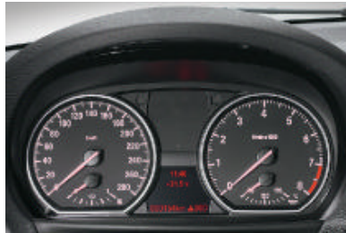
Instrumentenpaneel met analoge instrumenten en rode doorlichttechniek, snelheidsmeter, LC-display voor kilometer-/dagteller en boordcomputer, toerenteller met geïntegreerde tankinhoudsmeter (130i met motorolietemperatuurmeter, hier afgebeeld).