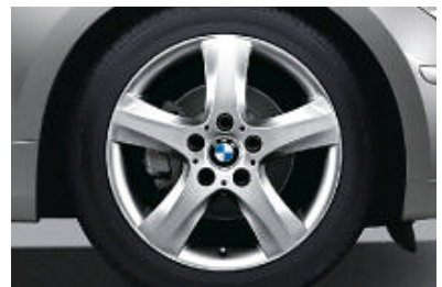
Lichtmetalen BMW wielen in sterspaak styling 142 met noodloopeigenschappen en bredere banden achter, voor 7 J x 17 inch en bandenmaat 205/50 R 17; achter 7,5 J x 17 inch en bandenmaat 225/45 R 17.