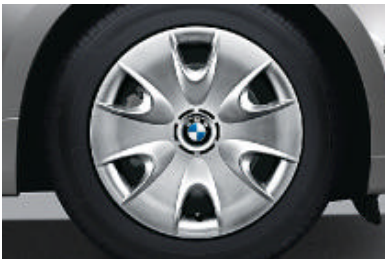
Stalen wielen met wielplaat en noodloopeigenschappen.