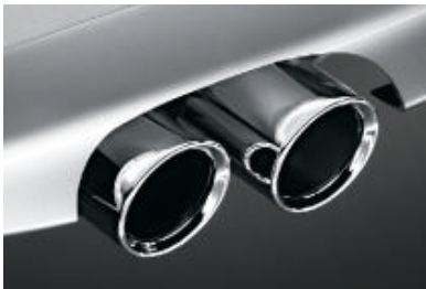
De dubbele uitlaat van de 130i is voorzien van mat verchromde eindpijpen.