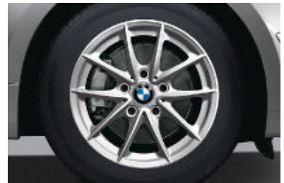
Lichtmetalen BMW wielen in V-spaak styling 360 met noodloopeigenschappen, 7 J x 16 inch, bandenmaat 205/55 R 16.