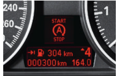
Auto Start Stop aanduiding. Toont in het info display wanneer de motor is afgezet door de Auto Start Stop functie, bijvoorbeeld voor een verkeerslicht of in een file. De aanduiding verdwijnt zodra de motor automatisch weer wordt gestart (voor alle viercilinder modellen; alleen i.c.m. handgeschakelde 6-versnellingsbak).