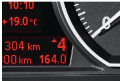
Schakelindicator (aanduiding ideale versnellingskeuze, alleen voor uitvoeringen met handgeschakelde 6-versnellingsbak). Adviseert u een hogere of lagere versnelling als deze een gunstiger brandstofverbruik mocht opleveren.