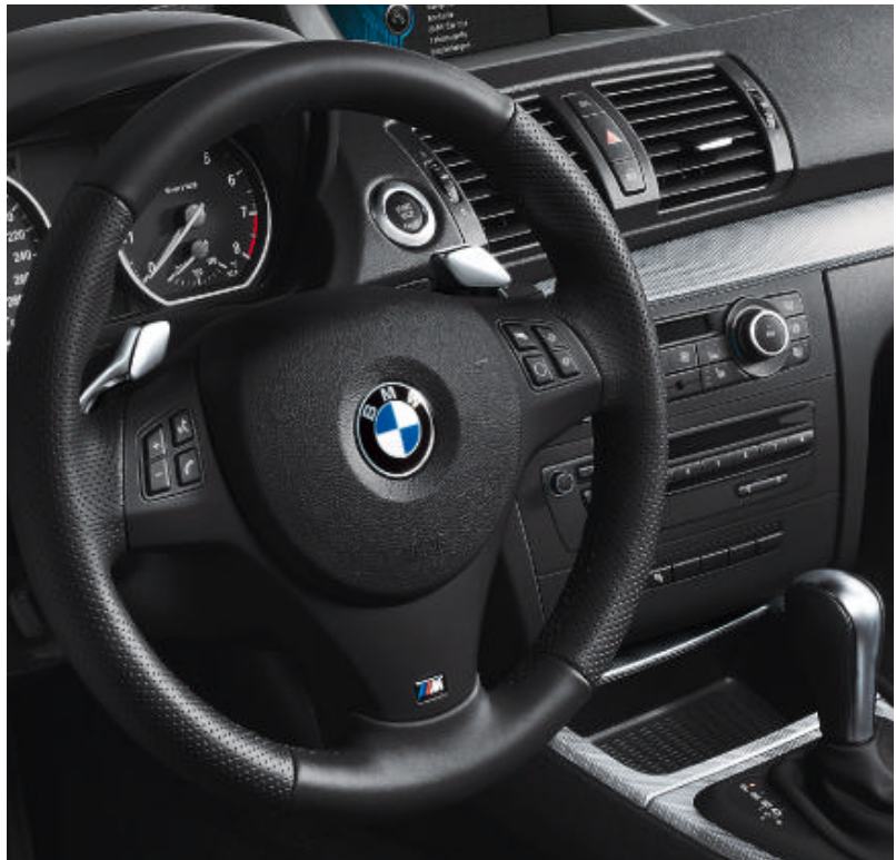
Schakelpaddles aan het stuur. In de 130i beschikt de optionele 6-traps automatische transmissie Steptronic over een sportmodus; de transmissie is tevens uitgerust met schakelpaddles aan het met leder beklede sportstuur of (afgebeeld) het met leder beklede M sportstuur.