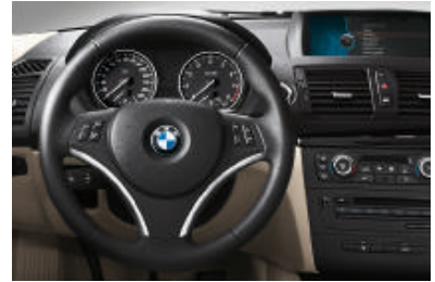
Met leder bekleed multifunctioneel sportstuur met geïntegreerde toetsen (diameter 369 mm), driespaaks. Met de toetsen kunnen tijdens het rijden bijvoorbeeld radio en telefoon (optie) worden bediend.

Stuurwielverwarming voor met leder bekleed multifunctioneel sportstuur: verwarmt met een druk op de knop binnen korte tijd de stuurwielkrans; zeer aangenaam in de winter.