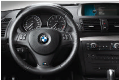
Met leder bekleed M sportstuur (diameter 369 mm), driespaaks, naar wens tevens verkrijgbaar als multifunctioneel M sportstuur, met toetsen voor de bediening van bijvoorbeeld radio en telefoon (beide optie). I.c.m. handgeschakelde versnellingsbak inclusief schakelpookknop met M embleem. Handremgreep en -manchet, alsmede schakelpookknop en -manchet zijn uitgevoerd in leder Walknappa.

Stuurwielverwarming voor met leder bekleed multifunctioneel sportstuur: verwarmt met een druk op de knop binnen korte tijd de stuurwielkrans; zeer aangenaam in de winter.