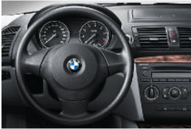
Standaard stuur (diameter 375 mm), driespaaks.

Voor de standaard- en extra-uitrusting verwijzen wij naar de uitrustings Tabellen.