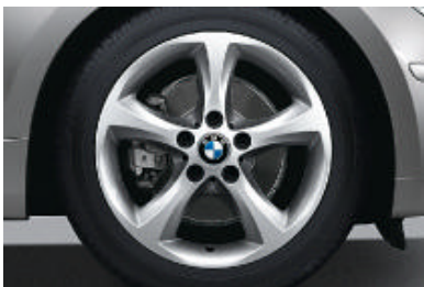
Lichtmetalen BMW wielen in sterspaak styling 256 met noodloopeigenschappen, 7 J x 17 inch, bandenmaat 205/50 R 17.