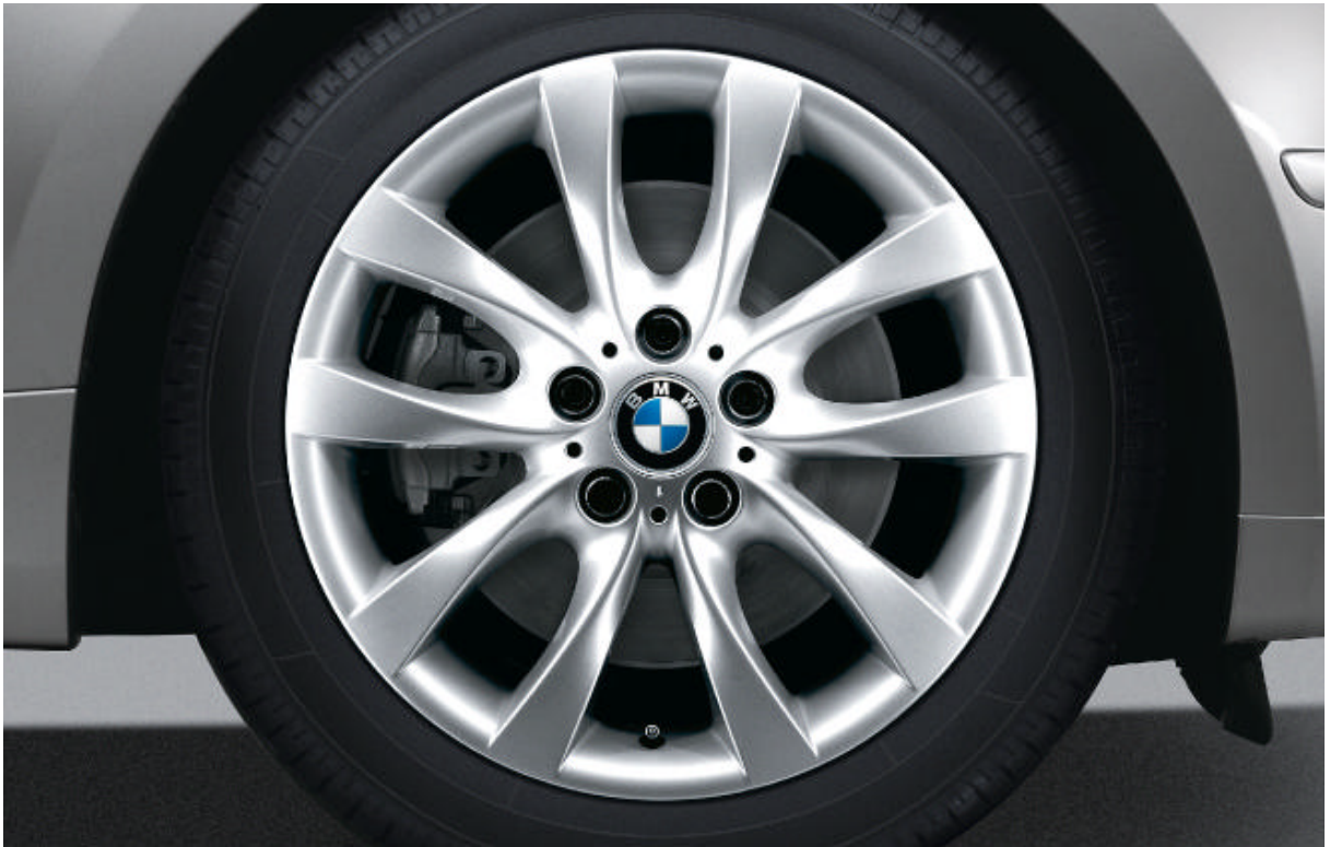
Lichtmetalen BMW wielen in V-spaak styling 217 met noodloopeigenschappen en bredere banden achter, voor 7,5 J x 18 inch en bandenmaat 215/40 R 18; achter 8,5 J x 18 inch en bandenmaat 245/35 R 18.

Voor de standaard- en extra-uitrusting verwijzen wij naar de uitrustings tabellen.