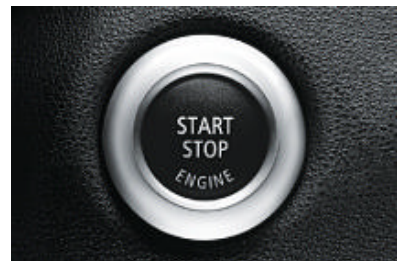
Start-/stopknop. Eerst wordt de afstandsbediening in de contactschakelaar geschoven. Daarna kunt u uw BMW met een druk op de knop starten of stoppen.

Keyless go. Voor het ver-/ontgrendelen en starten van de auto zonder de afstandsbediening ter hand te hoeven nemen.