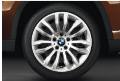
Lichtmetalen BMW wielen in dubbel-spaak styling 321 , 8 J x 18 inch, bandenmaat 225/45 R 18. Banden met noodloopeigenschappen.