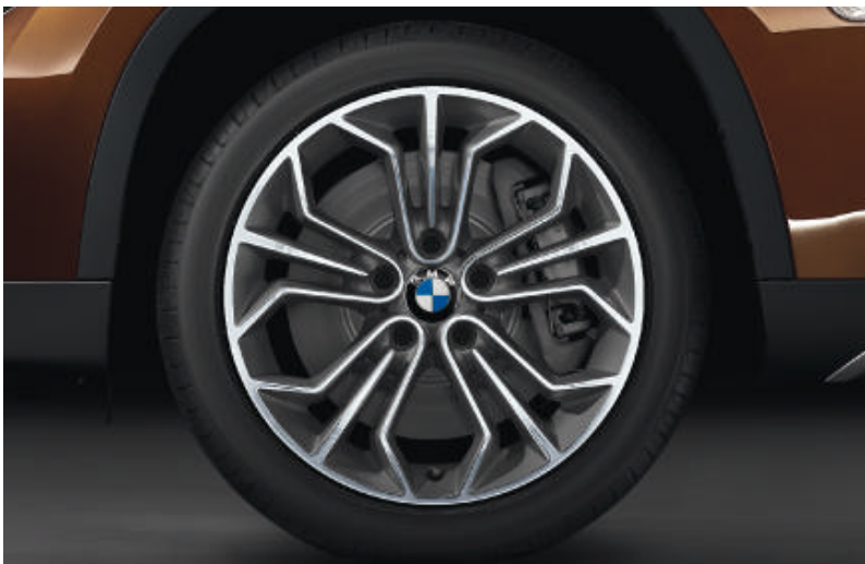
Lichtmetalen BMW wielen in honing-raatstyling 323 , bredere banden achter; voor 8 J x 18 inch en bandenmaat 225/45 R 18, achter 9 J x 18 inch en bandenmaat 255/40 R 18. Banden met noodloopeigenschappen.