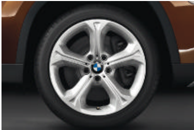
Lichtmetalen BMW wielen in sterspaak styling 320 , 8 J x 18 inch, bandenmaat 225/45 R 18. Banden met noodloopeigenschappen.