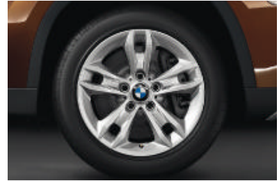
Lichtmetalen BMW wielen in sterspaak styling 319 , 7,5 J x 17 inch, bandenmaat 225/50 R 17. Banden met noodloopeigenschappen.