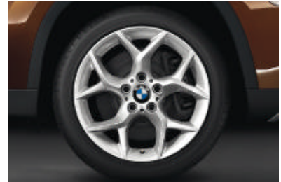
Lichtmetalen BMW wielen in Y-spaak styling 322 , bredere banden achter; voor 8 J x 18 inch en bandenmaat 225/45 R 18, achter 9 J x 18 inch en bandenmaat 255/40 R 18. Banden met noodloopeigenschappen.