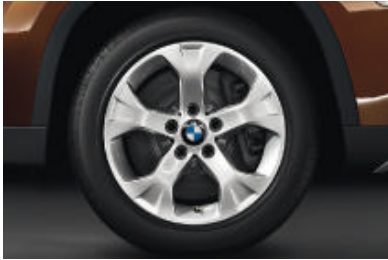
Lichtmetalen BMW wielen in sterspaak styling 317 , 7,5 J x 17 inch, bandenmaat 225/50 R 17. Banden met noodloopeigenschappen.

Voor de standaard- en extra-uitrusting verwijzen wij naar de uitrustingsstabellen.