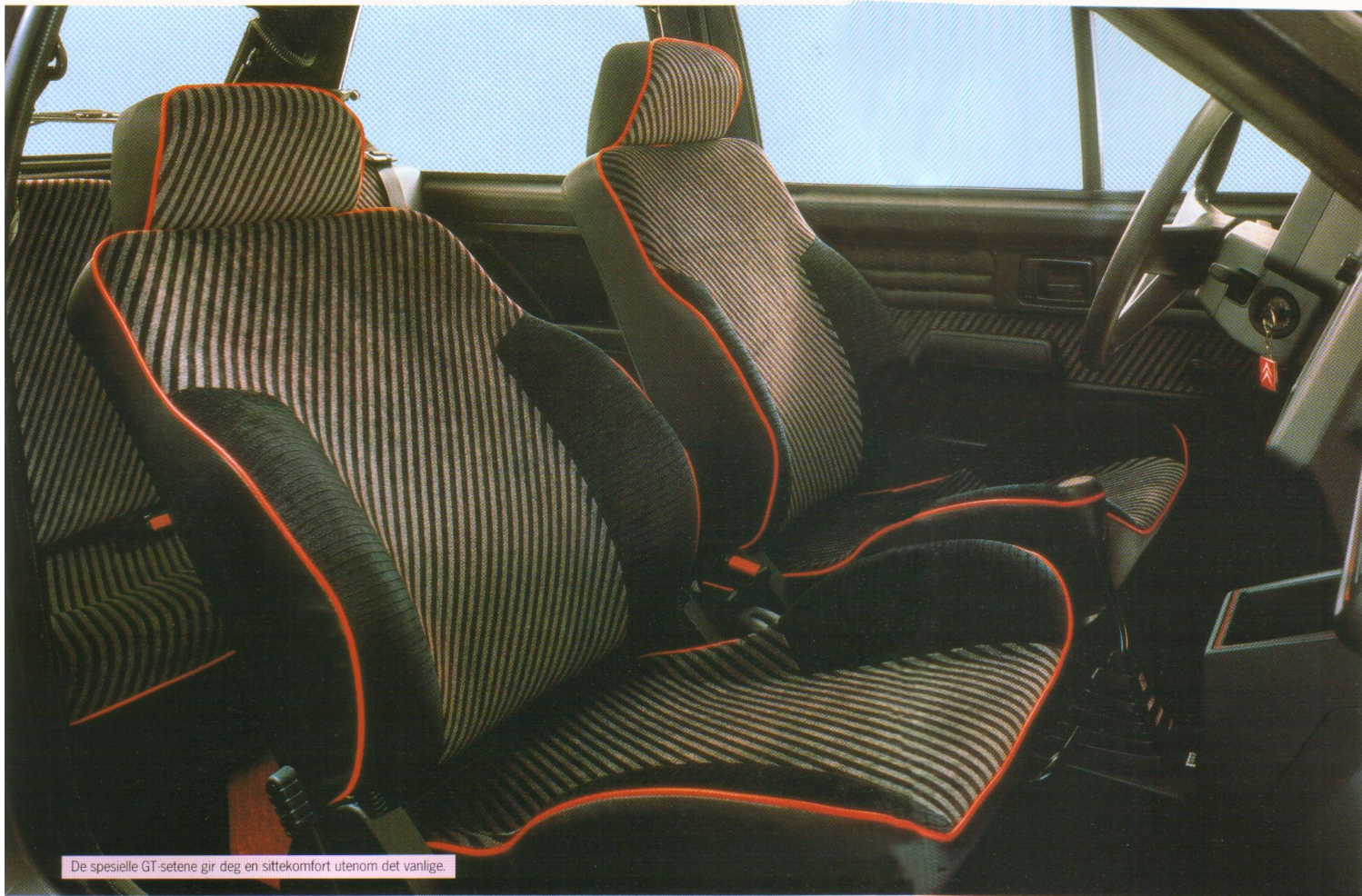
De spesielle GT-setene gir deg en sittekomfort utenom det vanlige.

C itroën AX har nå kommet i enda en ny, spennende versjon i Norge: AX GT! Med enda mer krefter, med enda mer utstyr, med enda bedre og mer sportslige kjøreegenskaper!