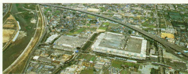
Daihatsu is een van de vier grootste autoproducenten van Japan. Ons hoofdkantoor is gevestigd in Osaka.

In Nederland rijden nu al meer dan 11 jaar Daihatsu's. En momenteel beschikken we over een netwerk van 135 dealers, verspreid door het hele land. Bij hen bent u van harte welkom om eens een proefrit te maken. Doe 't!