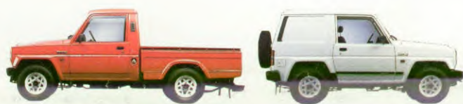
Links de Rocky Pick-Up. Met diesel motor. Rechts de Rocky Hard-Top met diesel- of turbodiesel motor.

De Rocky is verkrijgbaar als sportieve Soft-Top, solide Hard-Top, Pick-Up of als ruime Wagon. Ook met grijs kenteken, en bij de Wagon High Roof toch met ramen rondom!