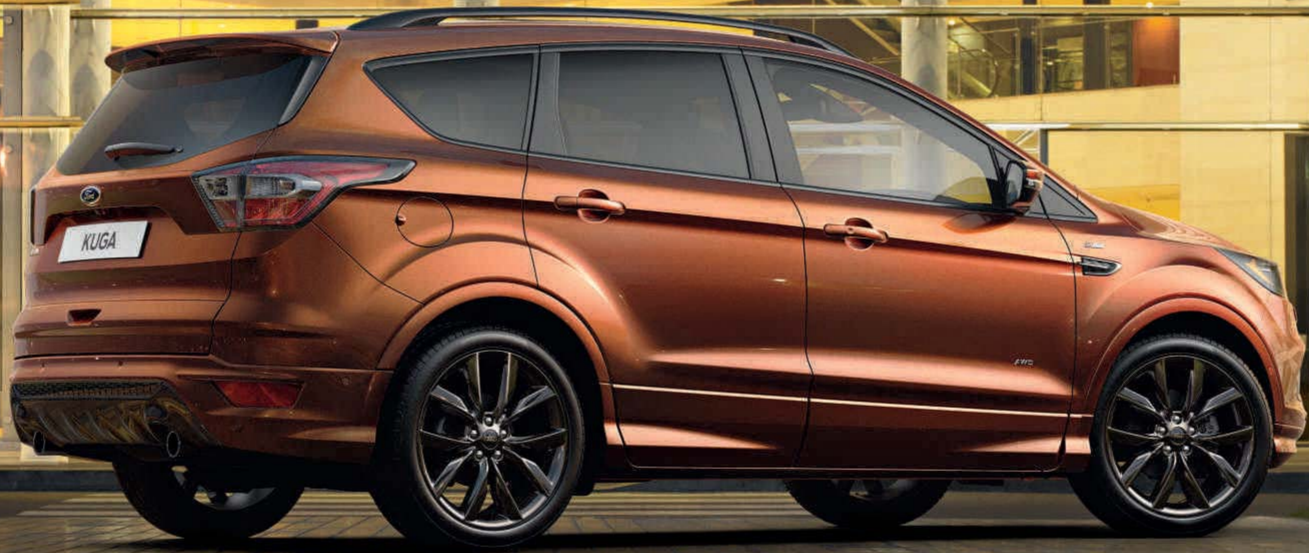
Getoond model is een Kuga ST-Line met optionele 19 inch lichtmetalen velgen, grote achterspoiler en Copper Pulse metaallak.