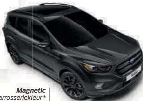
Magnetic Metallic carrosseriekleur* Td B T SL

De Ford Kuga dankt zijn fraaie en duurzame exterieur aan een grondig lakproces dat uit meerdere fasen bestaat. Van de stalen carrosseriedelen met wasinjectie tot de slijtvaste deklak: de nieuwe materialen en lakprocessen zorgen ervoor dat uw Ford Kuga zijn fraaie uiterlijk ook nog na jaren intensief gebruik behoudt.