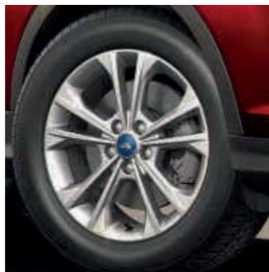
● 17 inch lichtmetalen velgen.