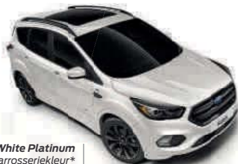
White Platinum 4-coat metallic carrosseriekleur* Td B T SL