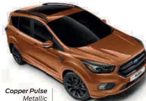
Copper Pulse Metallic carrosseriekleur* Td B T SL