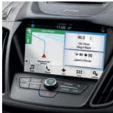
● Ford SYNC 3 met Voice Control en 8 inch touchscreen.