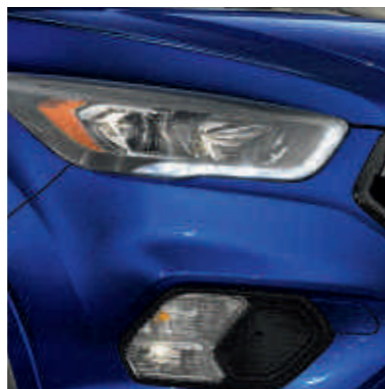
● Zwarte koplampserlijsten.