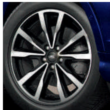
● 18 inch lichtmetalen velgen.