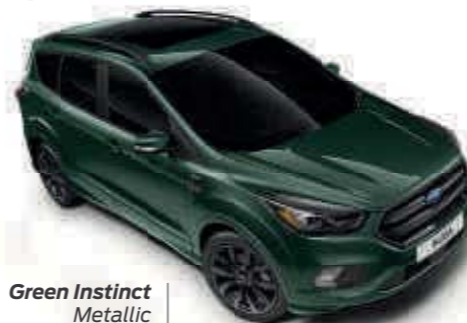
Green Instinct Metallic carrosseriekleur* Td B T SL