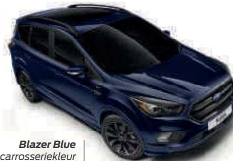
Blazer Blue Effen carrosseriekleur Td B T SL

Trend Essential Td Td Trend Ultimate B B Titanium T T ST-Line SL SL Standaard Optie