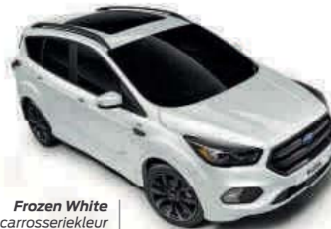
Frozen White Effen carrosseriekleur Td B T SL