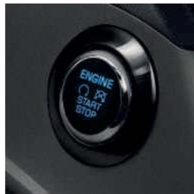
● FordPower startbutton