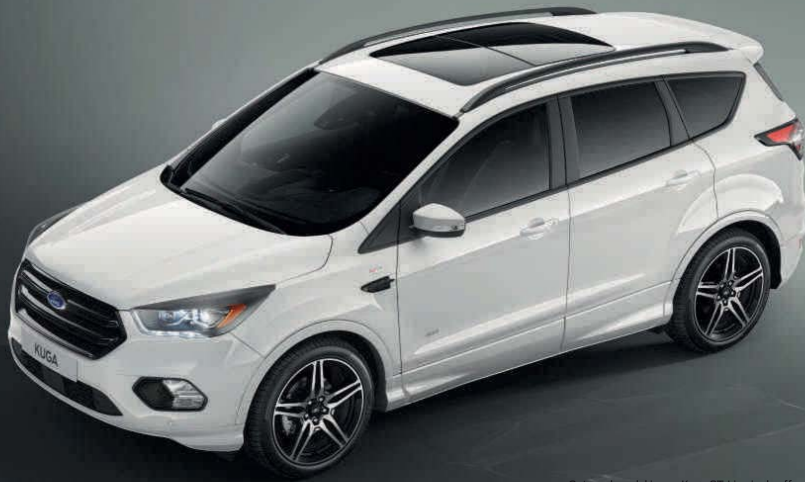
Getoond model is een Kuga ST-Line in de effen carrosseriekleur Frozen White, met optionele grote achterspoiler en 19 inch lichtmetalen velgen.