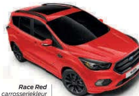
Race Red Effen carrosseriekleur Td B T SL