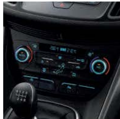
● Dual Zone Automatische Airconditioning (DEATC)