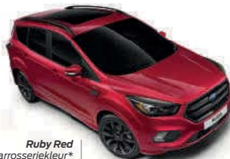
Ruby Red Tri-coat metallic carrosseriekleur* Td B T SL