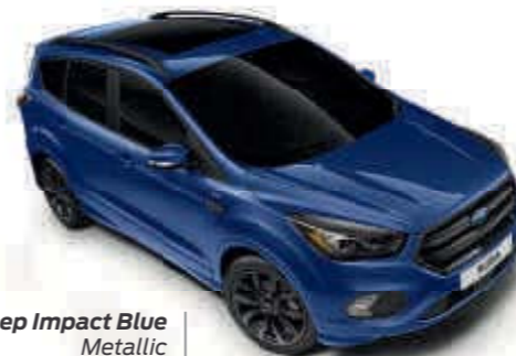
Deep Impact Blue Metallic carrosseriekleur* Td B T SL