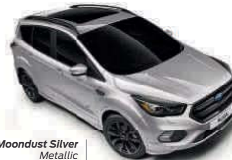
Moondust Silver Metallic carrosseriekleur* Td B T SL