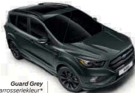
Guard Grey Metallic carrosseriekleur* Td B T SL