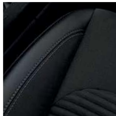
● Gedeeltelijk lederen stoelen.