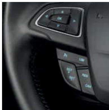
● Cruisecontrol met instelbare maximum-snelheidsbegrenzing.