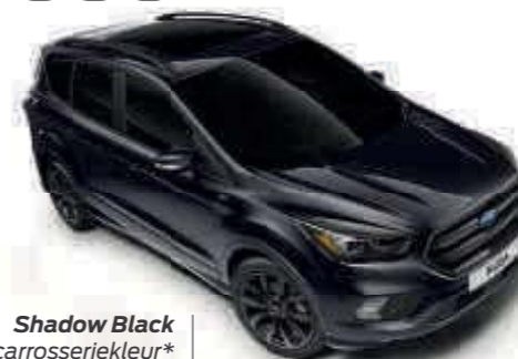
Shadow Black Mica carrosseriekleur* Td B T SL