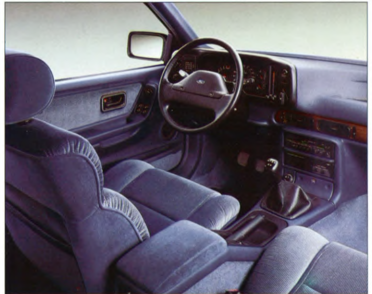
Interieur van Ghia

twee zelfblokkerende differentiëls met visco-koppelingen. Dankzij deze vernuftige constructie is Ford erin geslaagd om vierwielaandrijving te combineren met een antiblokkeerremstelsel.