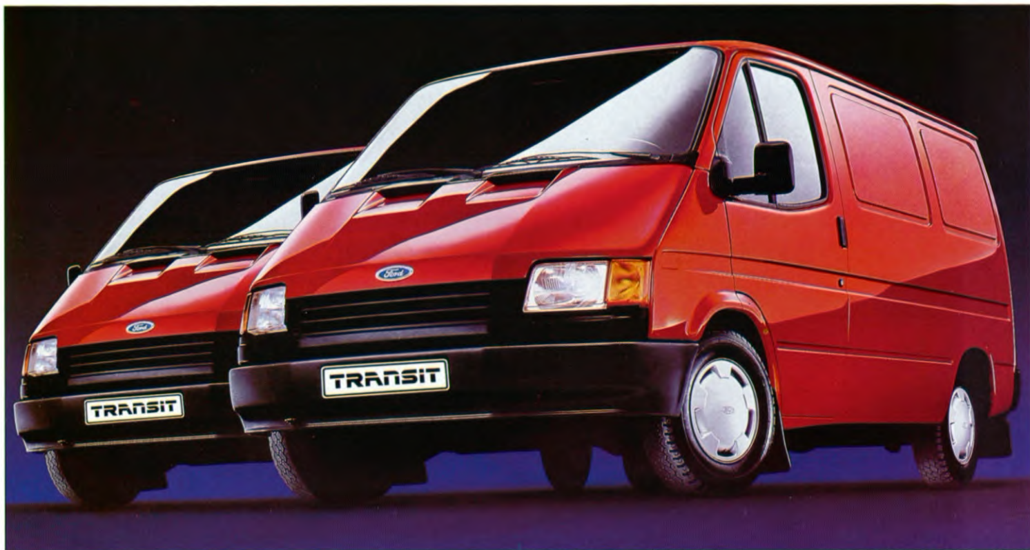
Transit gesloten bestelwagen