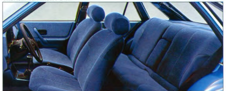
Interieur van Escort Ghia