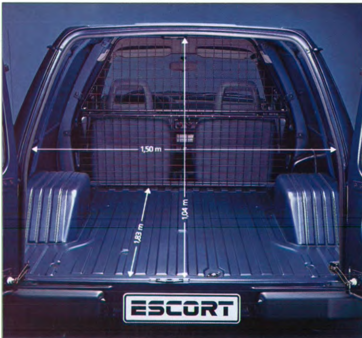
laadruimte Escort Van