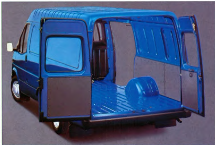
Transit met semi-verhoogd dak