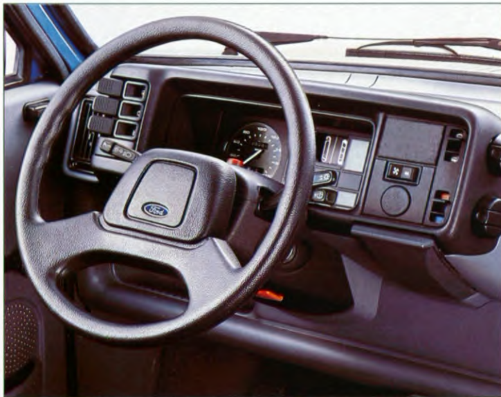
Interieur van Finesse