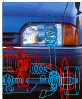
Speciaal anti-blokkerremstelsysteem voor wagens met voorwielaandrijving