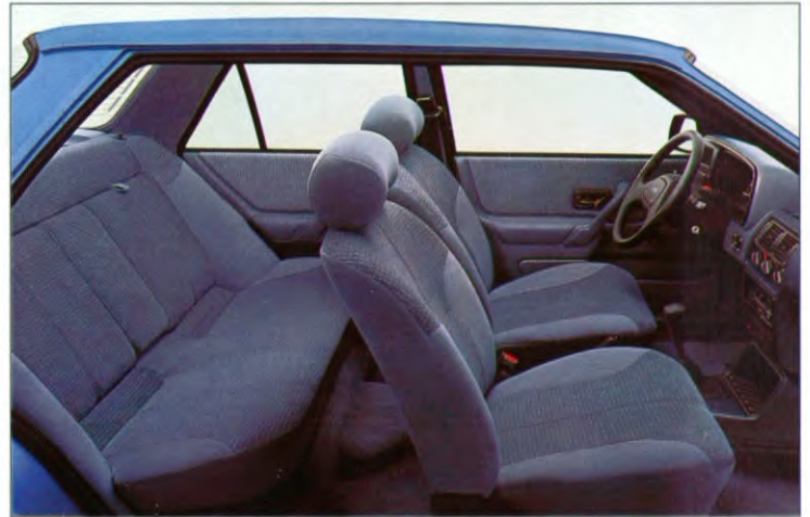
Interieur van Orion Ghia