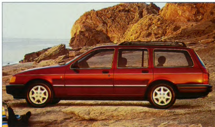
Ghia 4x4 stationwagon