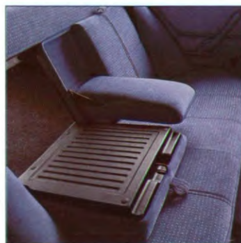
In 60/40-delen neerklapbare achterbankrugleuning (niet op CL)