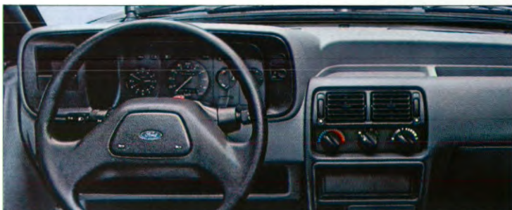
dashboard Escort Handy Van / Van