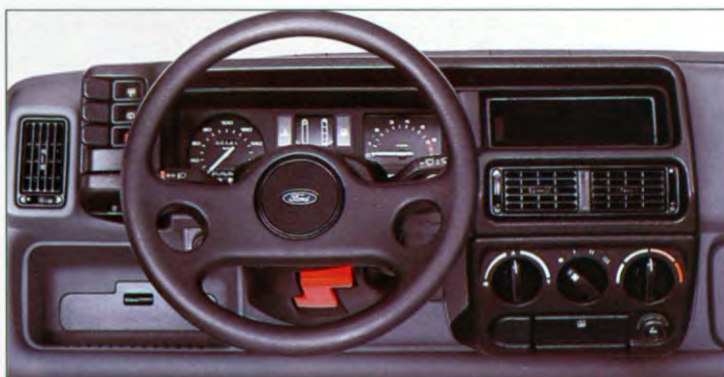
Het sportief uitgevoerde instrumentenpaneel van de Supersport

wiel geeft u een nauwkeurige controle over de wagen en de verstralers zorgen voor extra licht tijdens nachtelijke ritten. De standaarduitrusting omvat een boven de voorruit gemonteerd digitaalklokje, een ruitwischer en -sproeier op de achterraut en een uitgebreid instrumentarium met o. a. een toerenteller en een trajectkilometerteller. Het dashboardkastje is voorzien van een klep, terwijl zowel de stoelen als de portieren met een sportief ogende stof zijn bekleed.