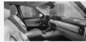
UW MAZDA CX-60