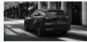
DE PASSIE OM TE RIJDEN