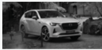
ALL-NEW MAZDA CX-60