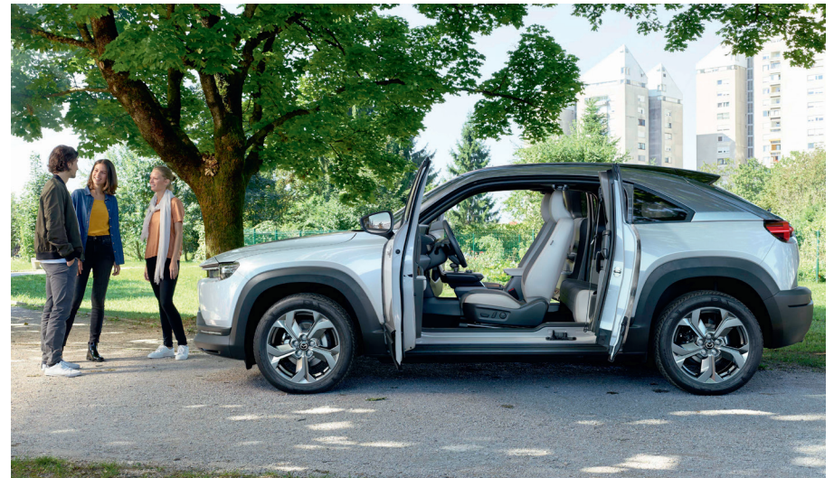
Foto rechts: Mazda MX-30 als First Edition uitvoering in Ceramic Metallic 3-Tone

Vanbinnen voelt deze crossover alleen nog maar groter. De voorstoelen zijn verder uit elkaar geplaatst, waardoor je als bestuurder meer interactie hebt met de inzittenden achterin. De ‚zwevende‘ middenconsole geeft een extra gevoel van ruimte. En de brede achterbank biedt plaats aan drie volwassenen.