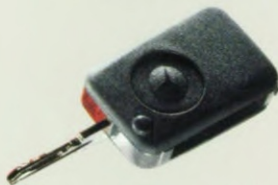
De infrarood-bediening voor de centrale vergrendeling (extra).