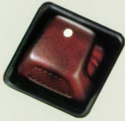
Heel eenvoudig te bedienen: de schakelaar voor de kap.

Wat is er aangenamer dan de warmte van de eerste zonnestralen? Eigenlijk alleen maar, dat u ervan geniet in een Mercedes-Benz met open dak. Zoals bijvoorbeeld de nieuwe