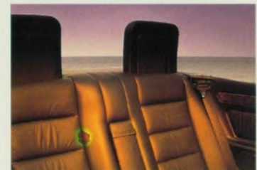
De verzonken rolbeugel. Indien nodig dient hij ook als hoofdsteun voor de achterpassagiers.