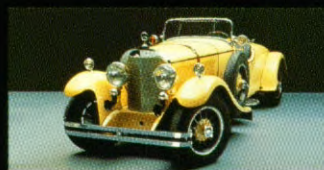
Klassieke sportwagen, 1926

En dat met name Mercedes-Benz u een daadwerkelijk fascinerend programma Sportline-varianten kan aanbieden, is niet zo verwon-