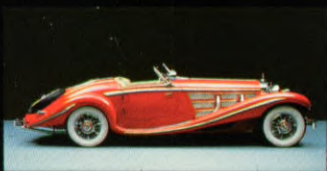
Sport-Roadster 500 K, 1936

rentie de baas. En een voorbeeld voor vele generaties sportwagens. Ook in de daaropvolgende decennia was de ontwikkeling van de sportwagens onlosmakelijk verbonden met het merk Mercedes. Zo werden onze "Silberpfeile" net zulke legendes als de SL-modellen, die niet alleen op de circuits maar ook op de boulevards van de grote steden