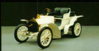
Daimler-Rennwagen „Mercedes“, 1901

Als uw eisen ten aanzien van sportiviteit in elke opzicht hoog zijn en u wilt dit ook