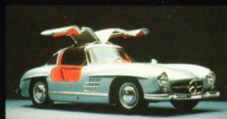
Sportcoupé 300 SL, 1954

rentie de baas. En een voorbeeld voor vele generaties sportwagens. Ook in de daaropvolgende decennia was de ontwikkeling van de sportwagens onlosmakelijk verbonden met het merk Mercedes. Zo werden onze "Silberpfeile" net zulke legendes als de SL-modellen, die niet alleen op de circuits maar ook op de boulevards van de grote steden