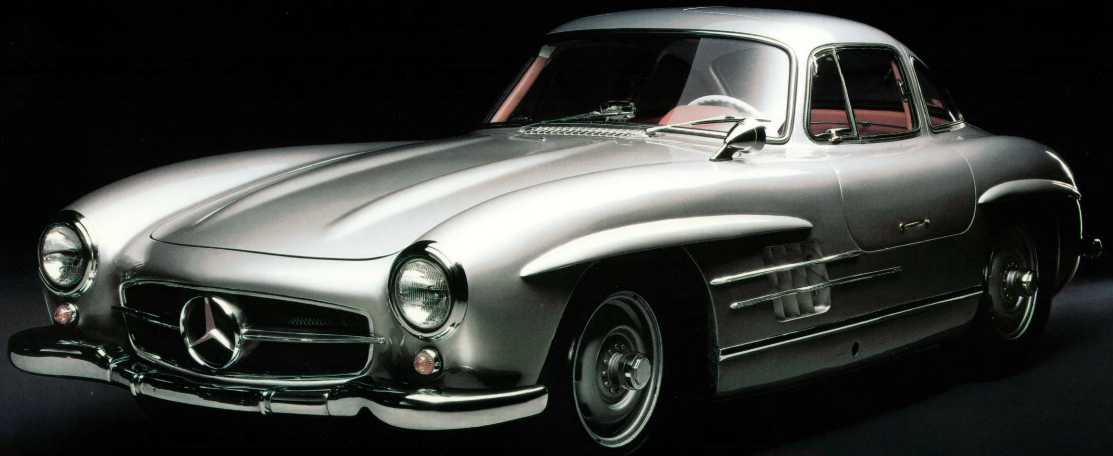
Mercedes-Benz SL 1954