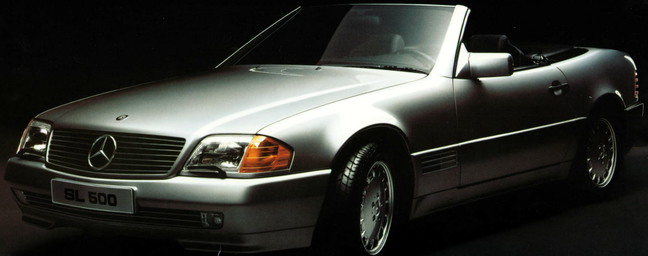
Mercedes-Benz SL 1989