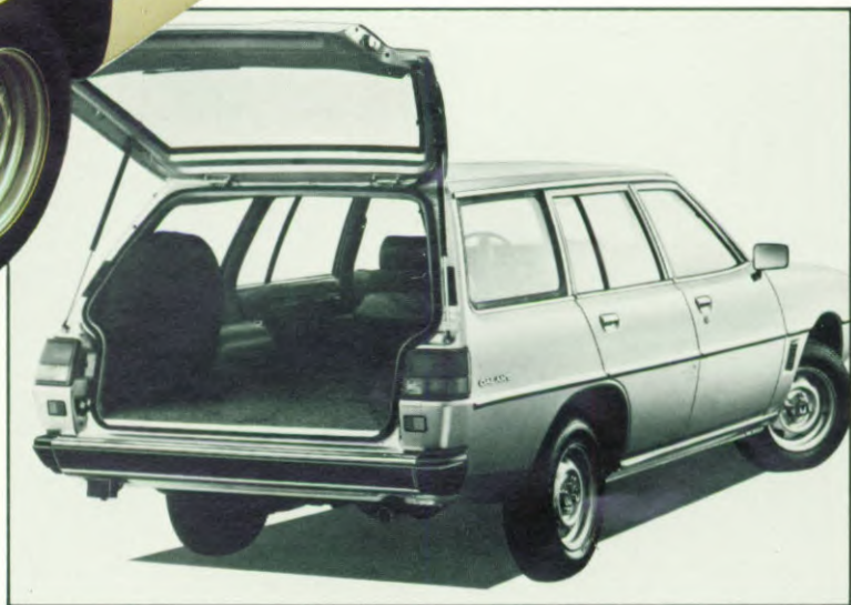
De ruime Galant Stationwagon, 1600 of 2000 cc. Ideaal voor gasinbouw onder de auto.

Een strakke, perfecte lijn. Vloeiend in de grille geïntegreerde lampen. Bumpers die geen extra luchtweerstand opleveren. Verzonken regenlijsten. Een minimale hellingshoek van de voorruit. Een kleine, maar effectieve voorspoiler. En een aerodynamisch ideaal kofferdeksel. Dat zijn de dingen die er aan bijdragen dat de Galant een luchtweerstandcoëfficiënt van maar 0,41 heeft. Zodat zijn brandstofverbruik voor zo'n grote en comfortabele auto aan de zeer bescheiden kant blijft. De economische motoren doen de rest. De 1600 serie (EL, GL, GLX) is zeer compleet en uiterst stil bovendien.