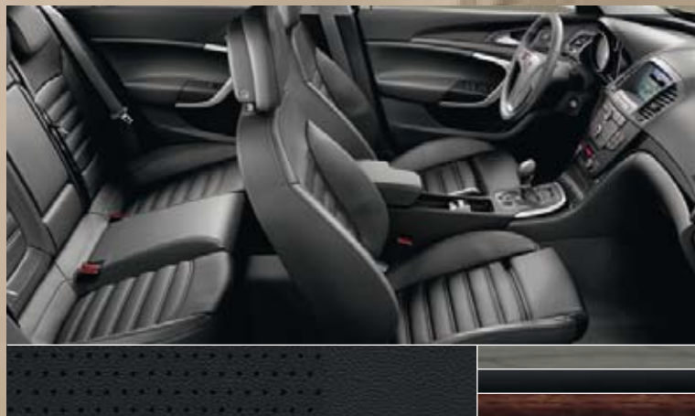
Leder Siena, zwart (geperforeerd) Dashboard: Rapid Cool, Piano Black, Kibo Wood