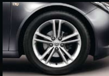
3 Lichtmetalen velg 8 J x 18, 5 dubbele spaken, bandmaat 245/45 R 18 (Q02).