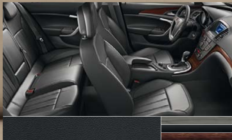
Leder Siena, zwart Dashboard: Rapid Cool, Piano Black, Kibo Wood