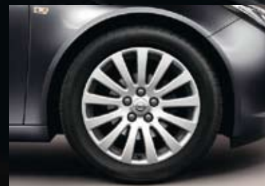
4 Lichtmetalen velg 8 J x 18, 13 spaken, bandmaat 245/45 R 18 (Q56).