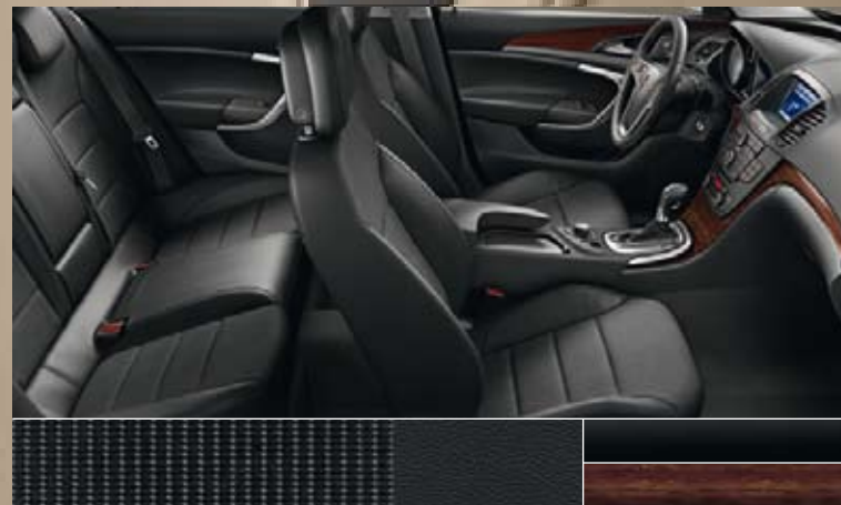
Avenue/Morrocana, zwart Dashboard: Piano Black, Kibo Wood