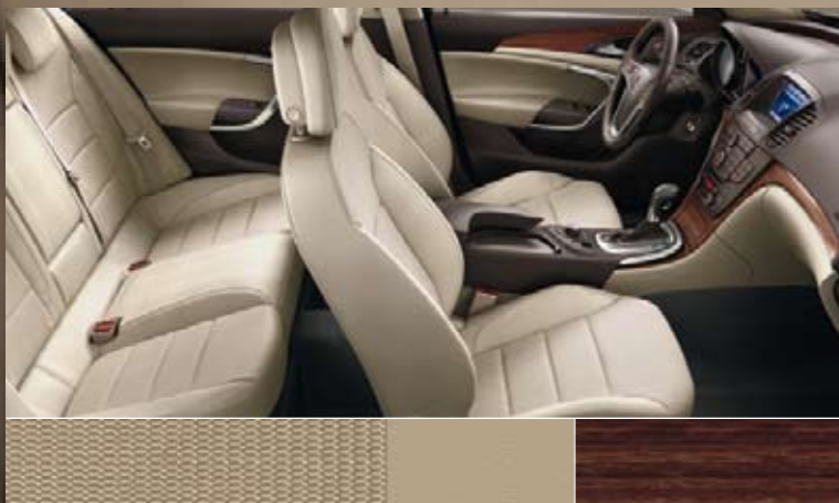
Avenue/Morrocana, beige Dashboard: Kibo Wood