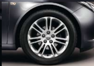
5 Lichtmetalen velg 8 J x 18, 7 dubbele spaken, bandmaat 245/45 R 18 (Q60).