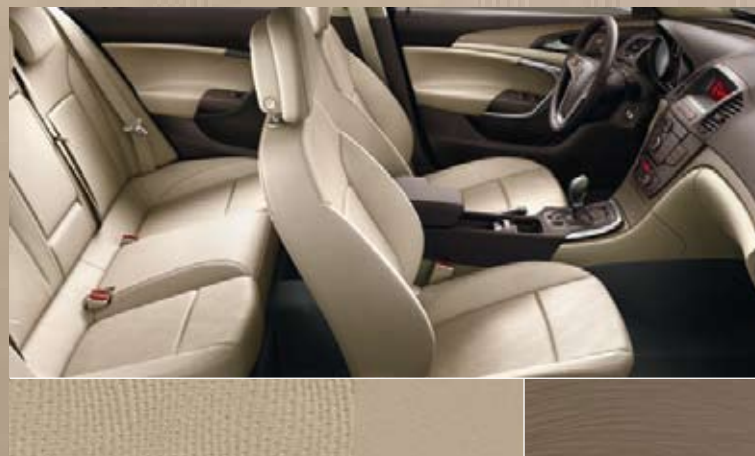
Dune/Atlantis, beige Dashboard: Rapid Warm