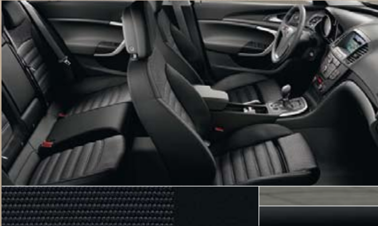
Vitesse/Atlantis, zwart Dashboard: Rapid Cool, Piano Black