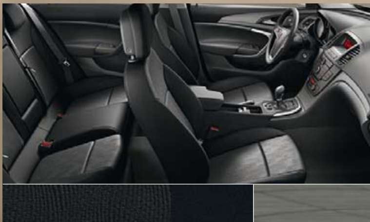
Dune/Atlantis, zwart Dashboard: Rapid Cool