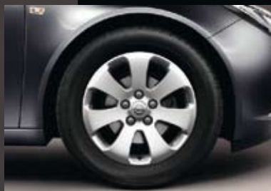
2 Lichtmetalen velg 7 J x 17, 7 spaken, bandmaat 225/55 R 17 (Q00).