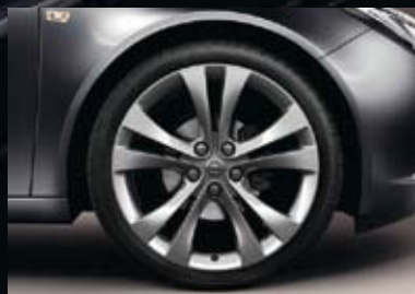
7 Lichtmetalen velg 8.5 J x 20, 5 dubbele spaken, bandmaat 245/35 R 20 (Q9U).