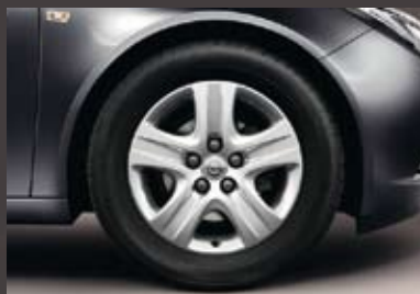
1 Designvelg, 7 J x 17, 5 spaken, bandmaat 225/55 R 17 (QR8).

3 Niet op 1.6 ECOTEC® en 2.0 CDTI ECOTEC® (110 DIN-pk).