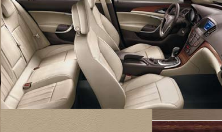
Leder Siena, beige Dashboard: Rapid Warm, Kibo Wood