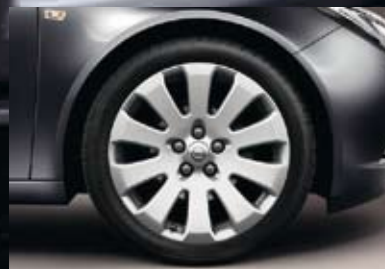
6 Lichtmetalen velg 8.5 J x 19, 10 spaken, bandmaat 245/40 R 19 (Q9S).