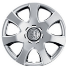
Wielplaat Cardoun 14''