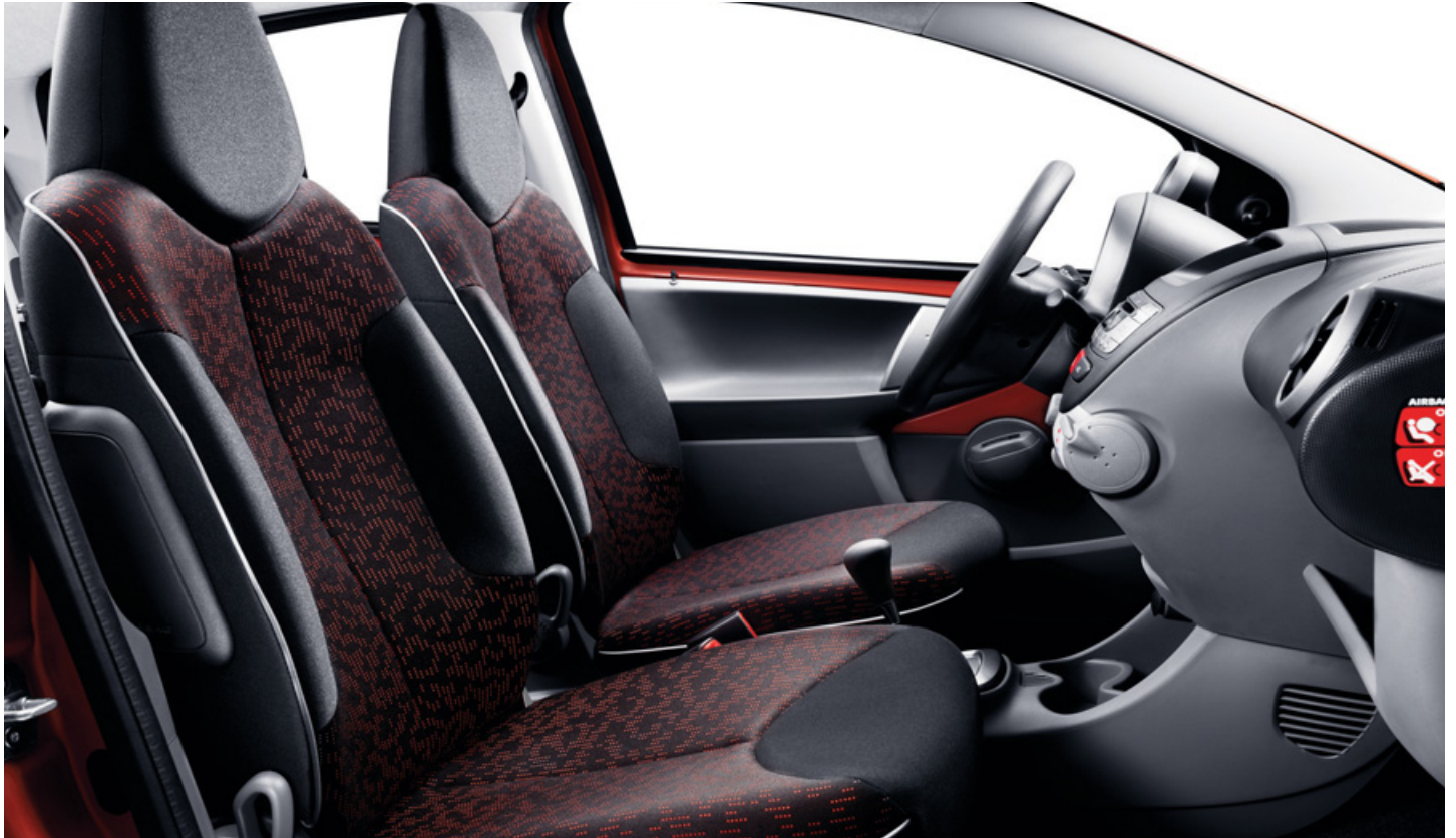
Geweven stof Stilada Mistral/Orange