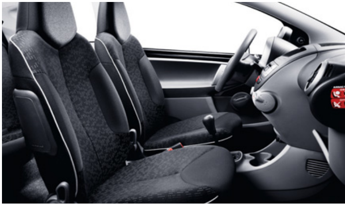
Geweven stof Stilada Mistral/Bise