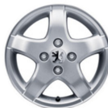
Lichtmetalen velg Karlova 14''