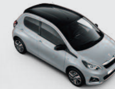
Bi-ton : Gris Gallium / Black Diamond