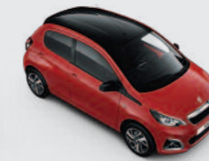
Bi-ton : Rouge Scarlett / Black Diamond