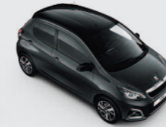
Bi-ton : Gris Carlinite / Black Diamond