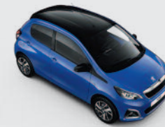
Bi-ton : Bleu Calvi / Black Diamond