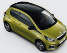
Bi-ton : Green Fizz / Black Diamond