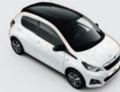
Bi-ton : Blanc Lipizan / Black Diamond