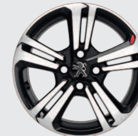
Lichtmetalen 15" velg Ligne S Standaard op GT Line