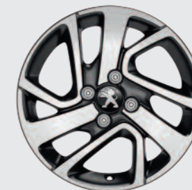
Gepolijste lichtmetalen 15" velg Thorren Standaard op Allure en Blue Lease Executive