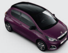
Bi-ton : Red Purple / Black Diamond

De Peugeot 108 is leverbaar in acht carrosseriekleuren. Bij de 108 3- en 5-deurs zonder vouwdak kunt u bovendien kiezen uit zeven Black Diamond* twotone-combinaties.