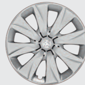
15" wioldop Brecola Standaard op Active TOP!