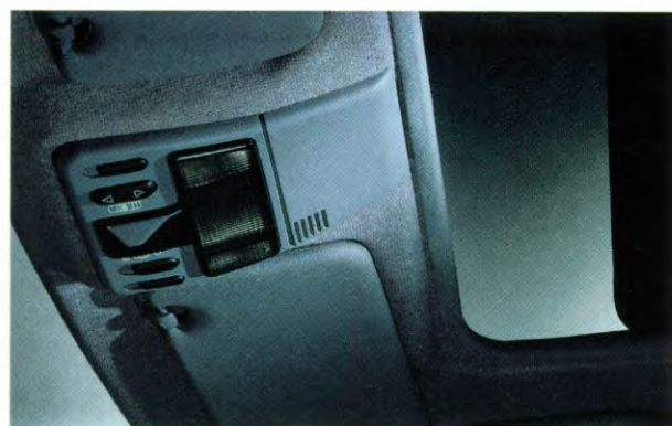
schuifdak, tegen meerprijs, met plafondconsole