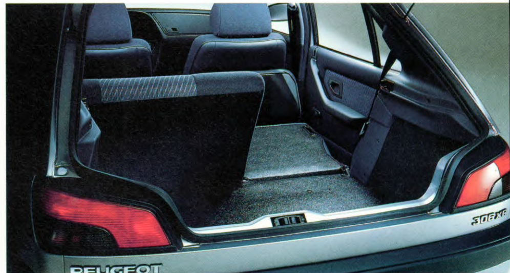
de in twee delen (40/60) neerklapbare achterbank