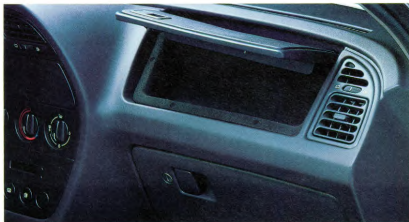
dashboard met twee kastjes