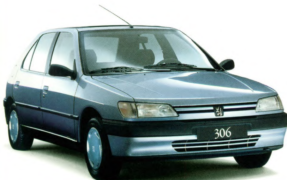
Peugeot 306 XR, verkrijgbaar met 1.4 of 1.6 liter motor