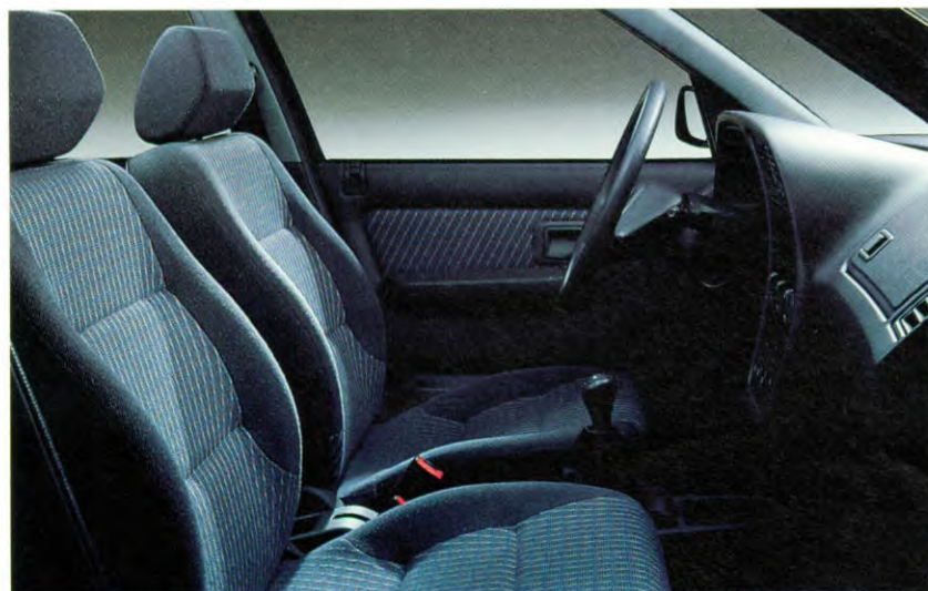
fraaie stoffen stoelbekleding en portierpanelen met lange en zachtbeklede armsteunen