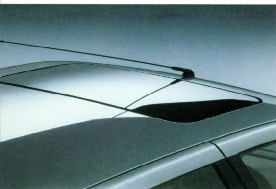
schuifdak, tegen meerprijs