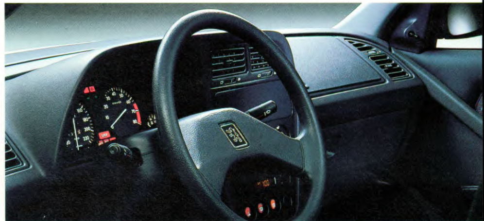
instrumentenpaneel met o.a. een elektronische toerenteller