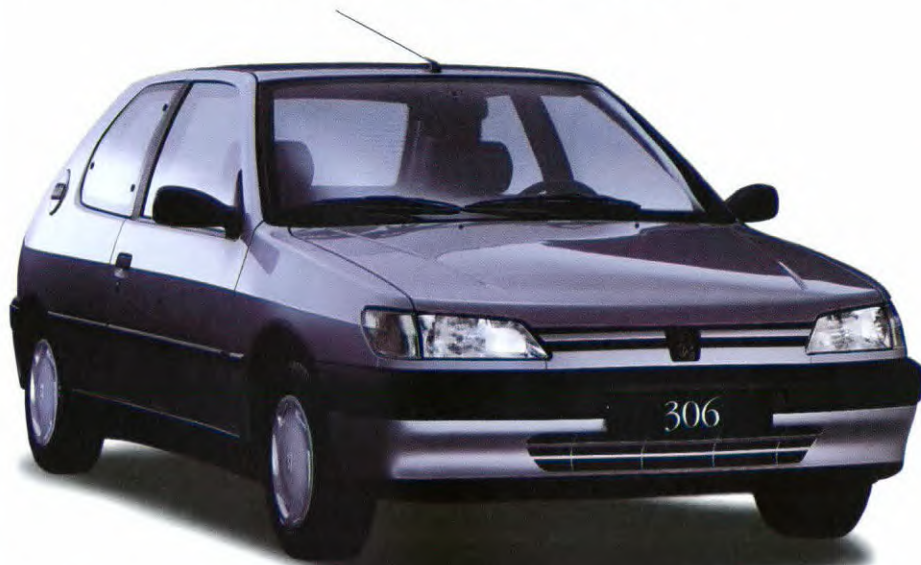
De Peugeot 306 XR: verkrijgbaar met 1.4 liter mono-point benzine-injectiemotor van 75 pk of met 1.6 liter multi-point benzine-injectiemotor van 90 pk of met de 1.9 liter dieselmotor van 71 pk.