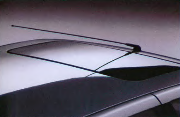
Elektrisch bedienbaar schuifdak tegen meerprijs.