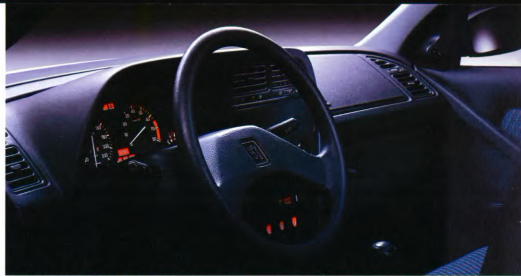
Instrumentenpaneel met onder andere een elektronische toerenteller.