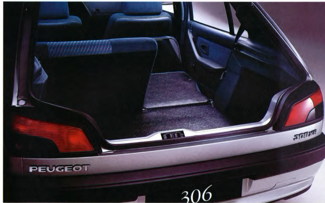
In twee delen (60/40) neerklapbare achterbank.