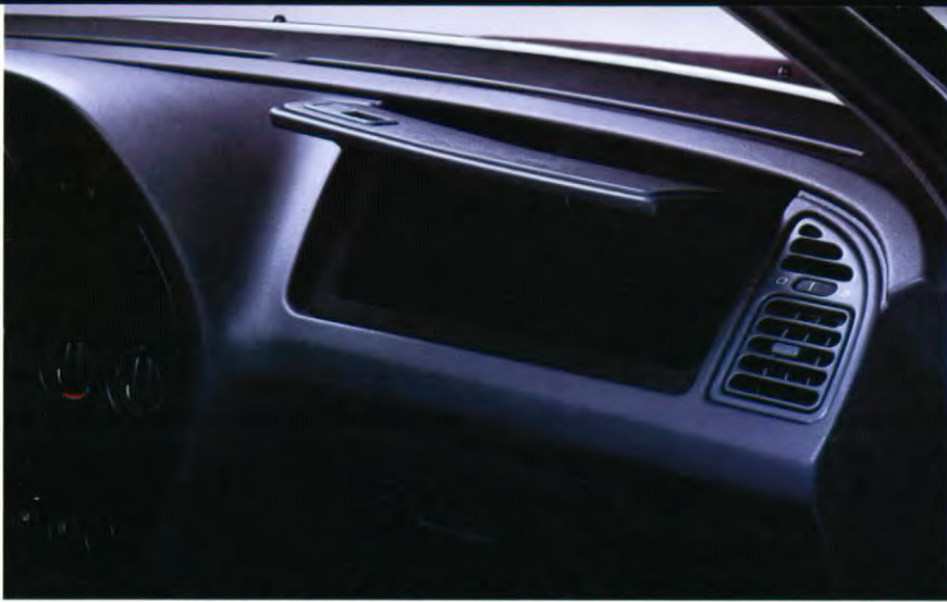
Fraai gestyleerd dashboard met twee kastjes met klep.