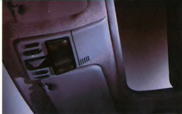
Plafondconsole met kaartleeslampje en plafonnier zoals uitgevoerd in combinatie met een elektrisch bedienbaar schuifdak (tegen meerprijs).