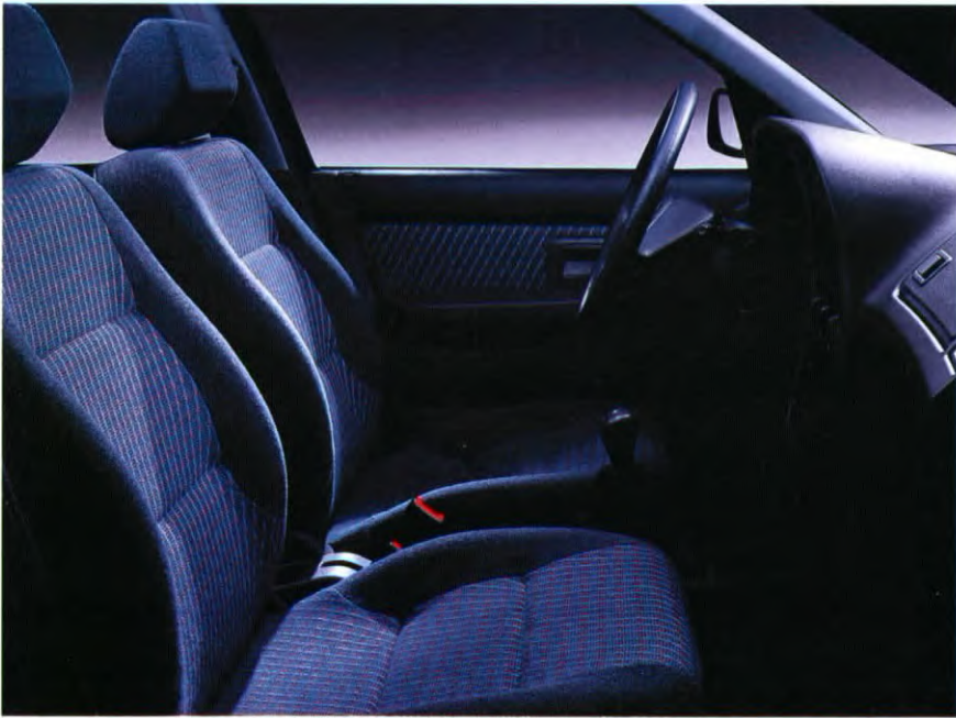
Luxe stoffen stoelbekleding, en portierpanelen met lange armsteun.