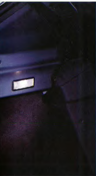
Verlichting voor de bagageruimte.