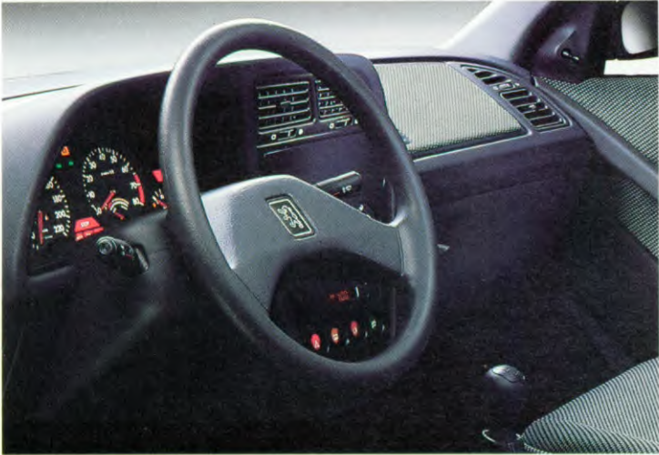
het instrumentenpaneel met regelbare verlichting