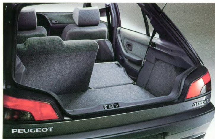
in twee delen neerklapbare achterbank