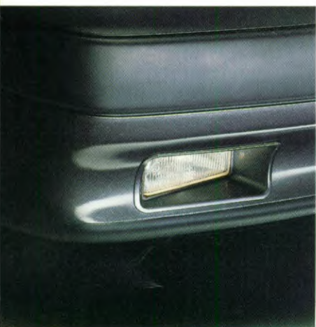
mistlampen vòòr, tegen meerprijs