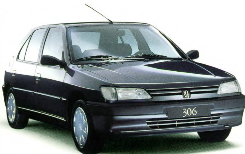
de Peugeot 306 XT, verkrijgbaar met 1.6 of 1.8 liter motor