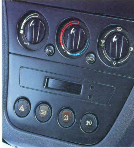
ventilatie/verwarmingssysteem (airco tegen meerprijs)