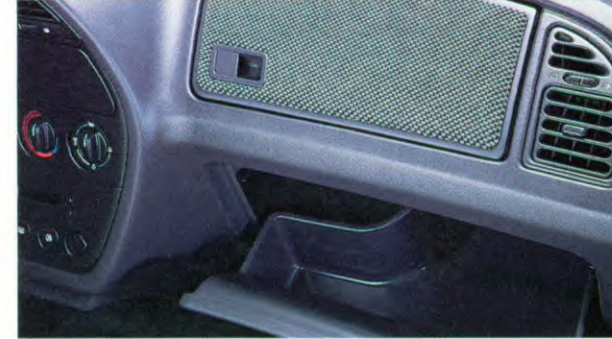
twee dashboardkastjes waarvan de bovenste bekleed met velours