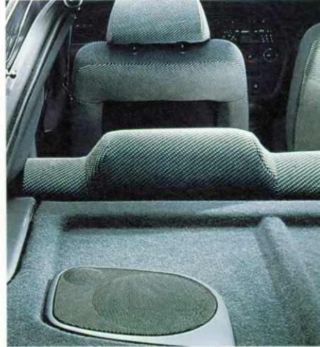
achterbank met geïntegreerde hoofdsteunen