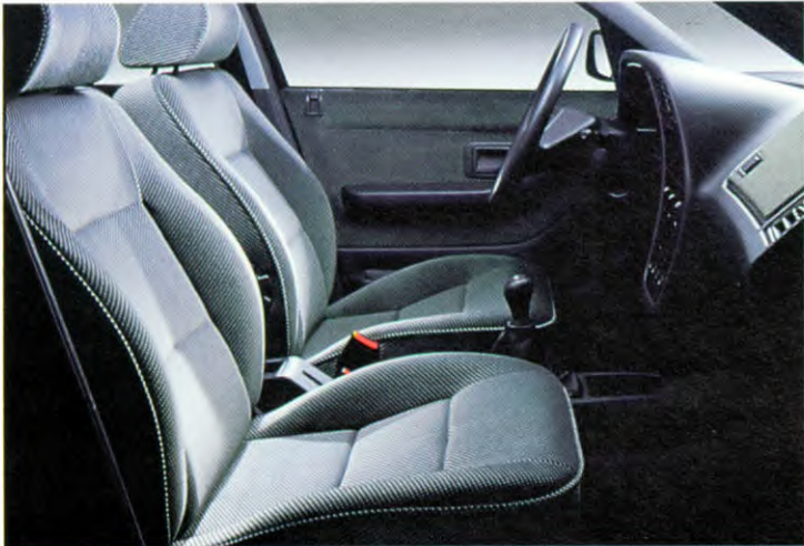
voorstoelen met veloursbekleding en kantelbare hoofdsteunen