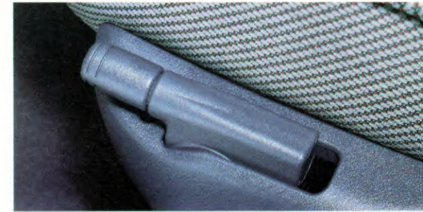
bedieningshandel hoogteverstelling bestuurdersstoel