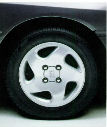
lichtmetalen velgen, tegen meerprijs