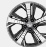
Lichtmetalen velg 18" DIAMANT (Blue Lease GT)