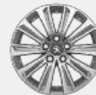
Lichtmetalen velg 16" ZIRCON (Blue Lease Allure)