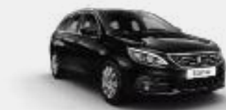
Noir Perla Nero**