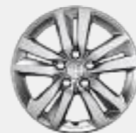
Lichtmetalen velg 16" QUARTZ (Blue Lease Active)

Afhankelijk van het uitrustingsniveau is uw PEUGEOT 3008 uitgerust met 16 of 18-inch lichtmetalen velgen.