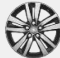
Lichtmetalen velg 16" JADE (accessoire)