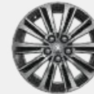
Lichtmetalen velg 16" ZIRCON twotone (accessoire)