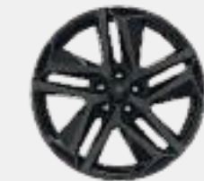
Lichtmetalen velg 18" BLACK SAPHIR (optie Black Pack)