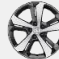
Lichtmetalen velg 17" RUBIS (accessoire)