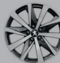
18" HIRONE two-tone