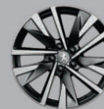
18" SPERONE two-tone