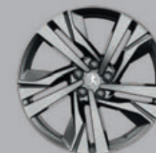
19" AUGUSTA two-tone