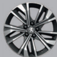
17" MERION two-tone