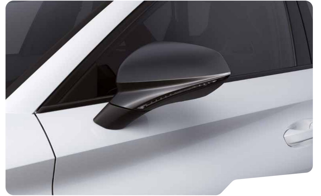
↓ NEVADA WHITE