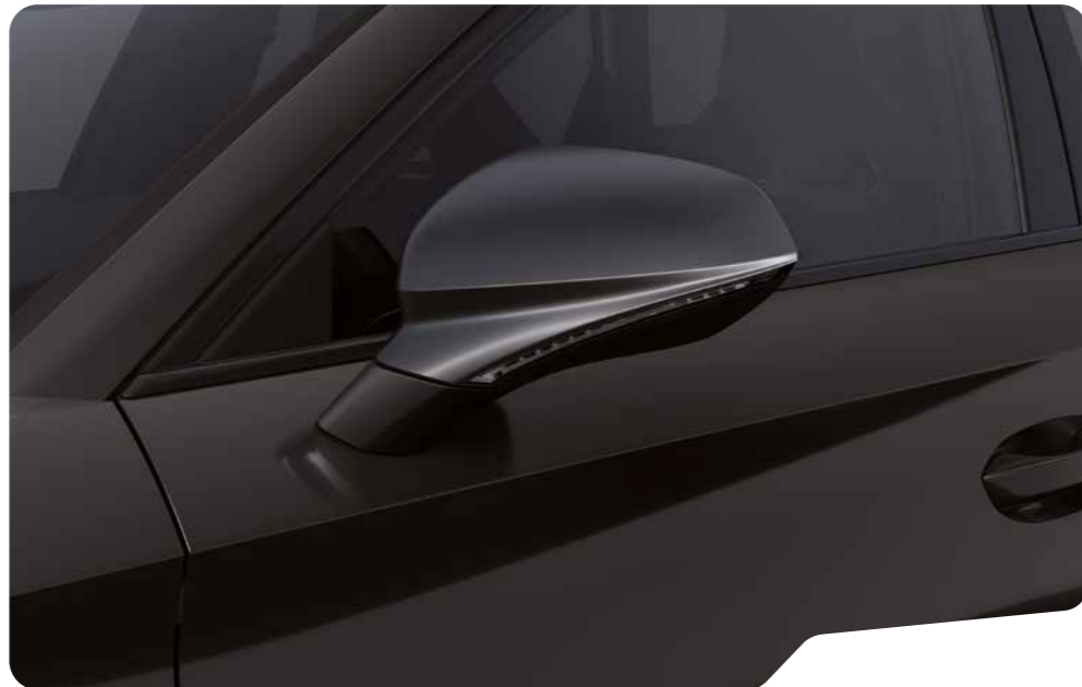
↓ MIDNIGHT BLACK