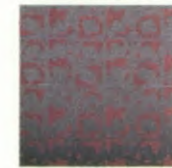
GLX red business