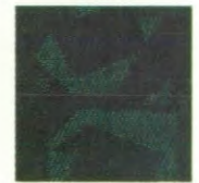
GLX green business