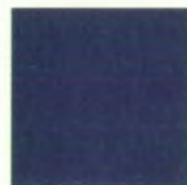
Caribbean blue metallic D7D7