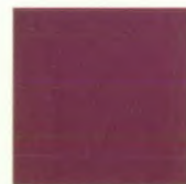
Hot chili red metallic E1E1