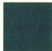
Granite metallic L8L8