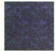
GLX blue business