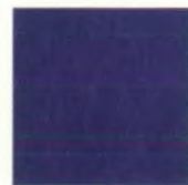
Nautic blue J4J4