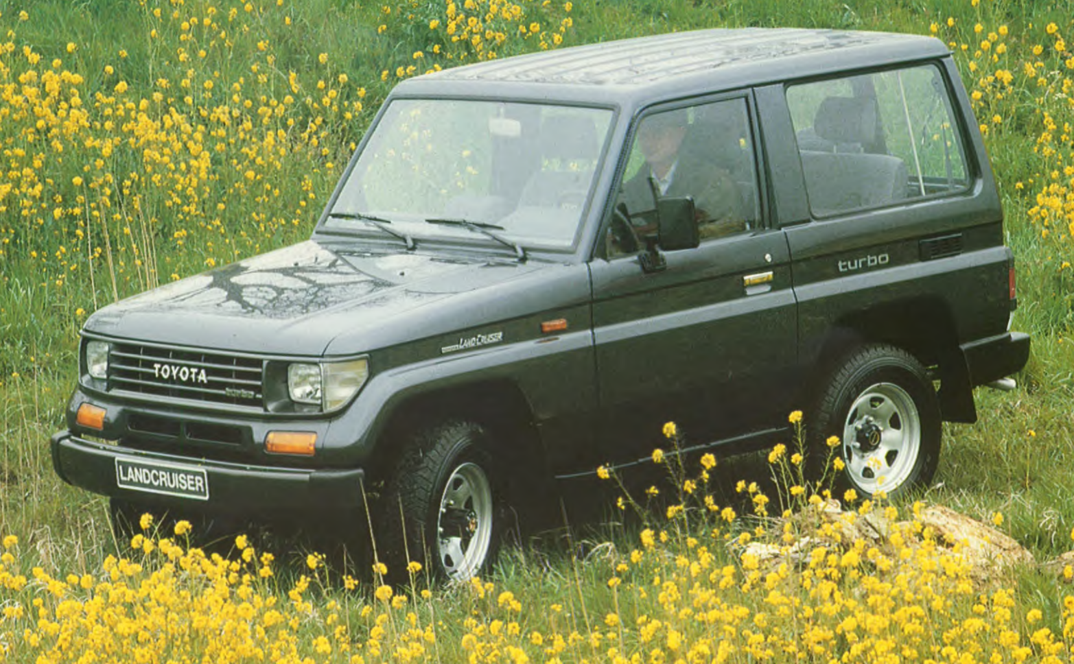
LandCruiser Hardtop schroefgeveerd