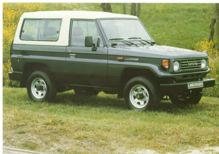
LandCruiser FRP bladgeveerd

Ook het motorenprogramma van de LandCruiser-serie werd gewijzigd. Er zijn vier verschillende motoren beschikbaar. De viercilinder 2.4 liter benzine motor levert een vermogen van 81 kW. Met dezelfde cilinder-