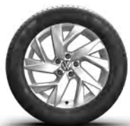
Frankfurt (E) (O)