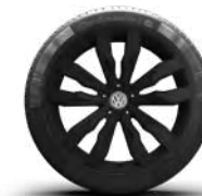
Suzuka in zwart uitgevoerd (O)