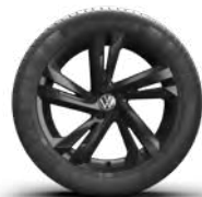
Valencia in zwart uitgevoerd (O)