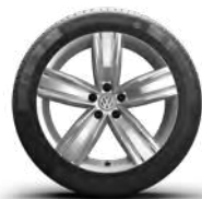
Victoria Falls (O)