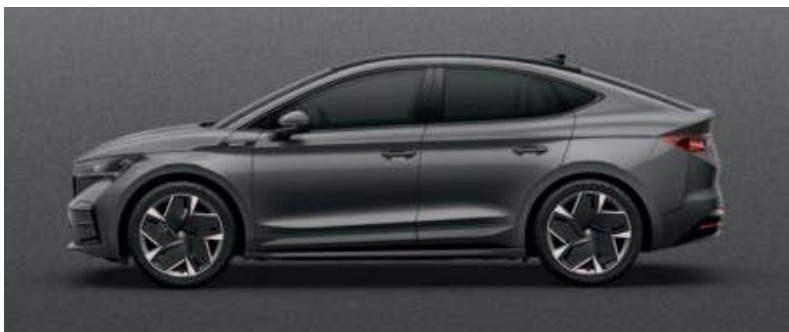
GRAPHITE GREY METALLIC