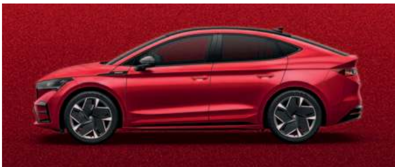
VELVET RED METALLIC