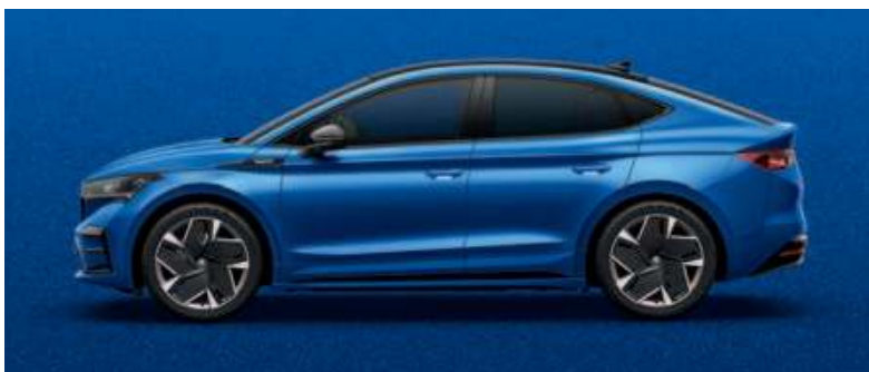
RACE BLUE METALLIC