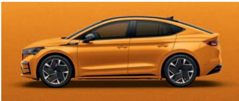
PHOENIX ORANGE METALLIC