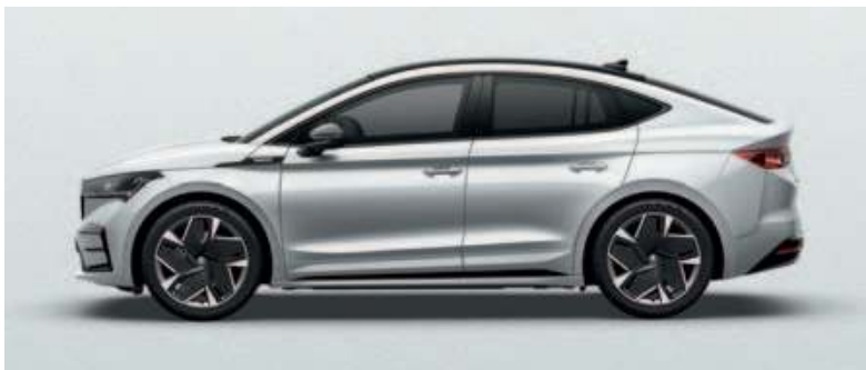
MOON WHITE METALLIC