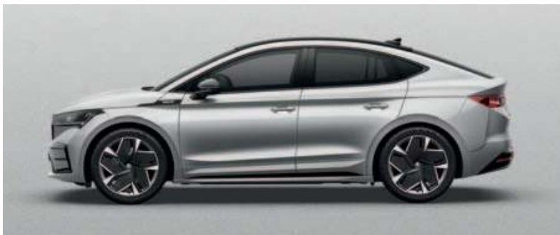
BRILLIANT SILVER METALLIC