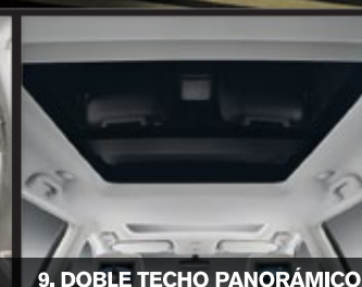
9. DOBLE TECHO PANORÁMICO

Sistema de entretenimiento con monitores independientes de 7" en apoyacabezas delanteros, DVD con entradas auxiliares, control remoto y dos audífonos inalámbricos*.