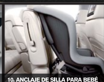
10. ANCLAJE DE SILLA PARA BEBÉ

Sunroof y techo panorámico para los ocupantes de las tres filas de asientos*.