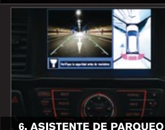
6. ASISTENTE DE PARQUEO

Cámara de reversa con sensores de parqueo. Monitor de visión periférica con tres cámaras: una frontal y dos laterales*.