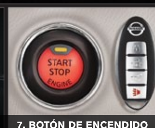
7. BOTÓN DE ENCENDIDO

Cámara de reversa con sensores de parqueo. Monitor de visión periférica con tres cámaras: una frontal y dos laterales*.