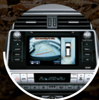
MULTI TERRAIN SELECT* (4 CÁMARAS)