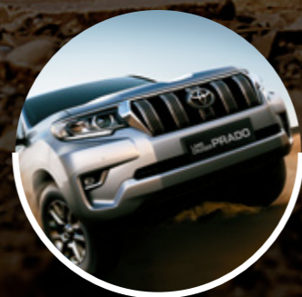
SISTEMA CRAWL CONTROL*