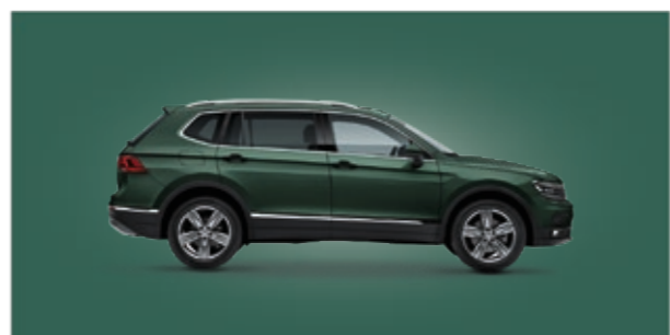
Verde Musgo Oscuro