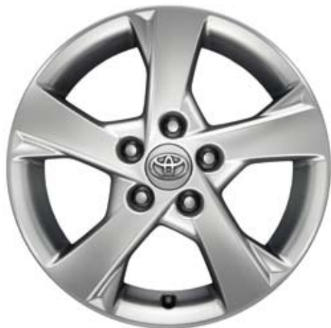
Jantes de 16" em liga leve De série na versão Exclusive