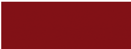
355 Vermelho Igneo