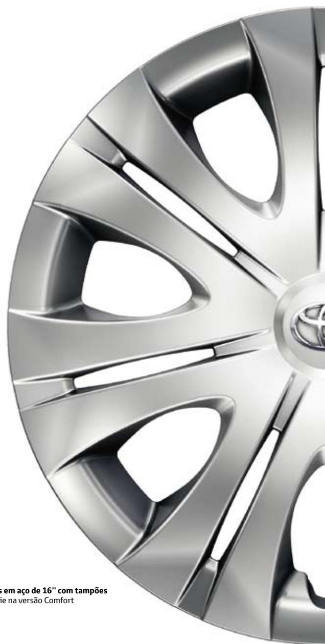
Jantes em aço de 16" com tampões De série na versão Comfort