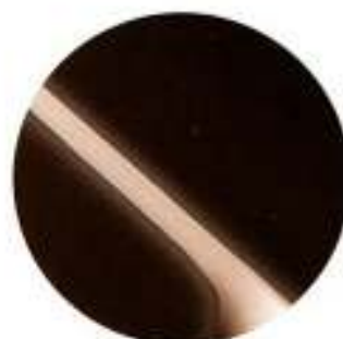
442 Java Metalizado*