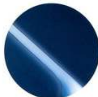
417 Azul Metalizado