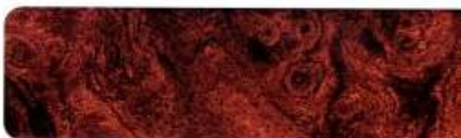
Aplicações tipo madeira Claret