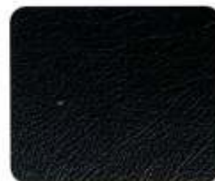
Couro desportivo Preto (8A70)