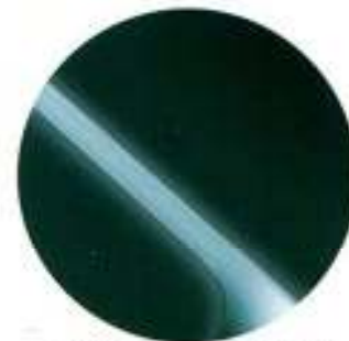
447 Verde Scarab Metalizado*