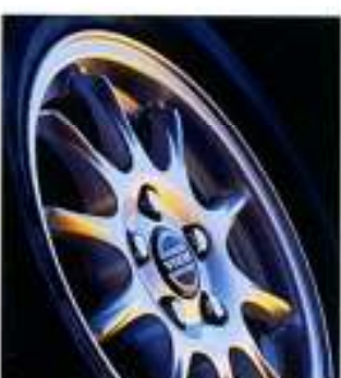
Argon 6,5x15" (ultra-leve)