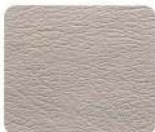
Couro Executive Arena (8E91)

Aplicações em madeira genuína no tablier e manípulo da alavanca da caixa de velocidades* incluídas de série, podendo ser complementadas com aplicações condizentes no volante.