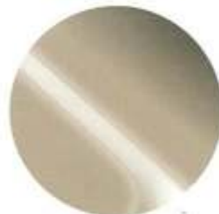
446 Dourado Metalizado*