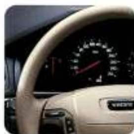
Volante em couro, Light Sand