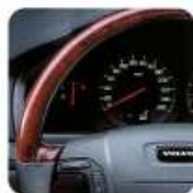
Volante em couro, Grafite com aplicações tipo madeira Claret