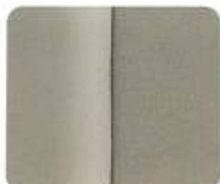
Tecido/couro Wasa Arena (8391)