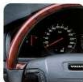
Volante em couro, Grafite com aplicações tipo madeira Claret