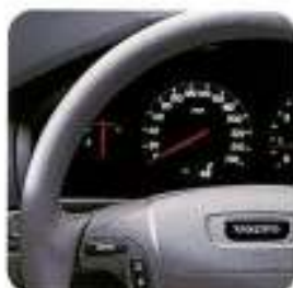
Volante em couro, Granito