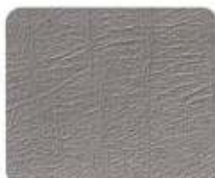
Couro Granito (8941)