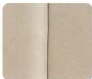
Couro/tecido Wasa Light Sand (835A)