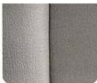
Tecido/couro Wasa Granito/Preto (8379)