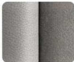
Bergen Alcantara*/Couro Granito/Preto (8879)