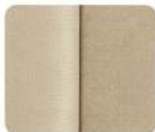
Bergen Alcantara*/Couro Light Sand (885A)