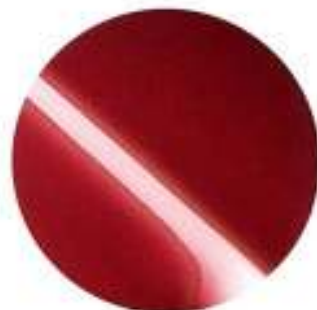
445 Vermelho Veneza Metalizado