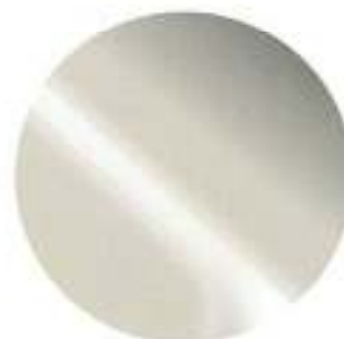
443 Moondust Metalizado