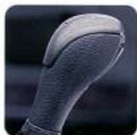
Manipulo da alavanca da caixa de velocidades com aplicações em alumínio Dynamic