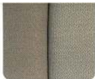
Tecido Birka Arena (8191)