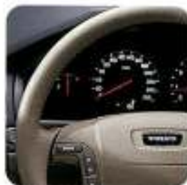
Volante em couro, Oak