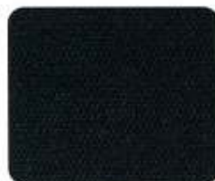
Sarek Plush Preto (8470)