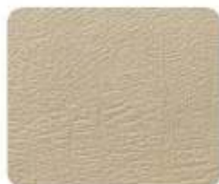
Couro Light Sand (885A)