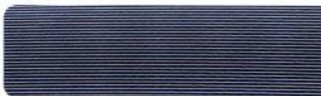
Aplicações em alumínio Dynamic