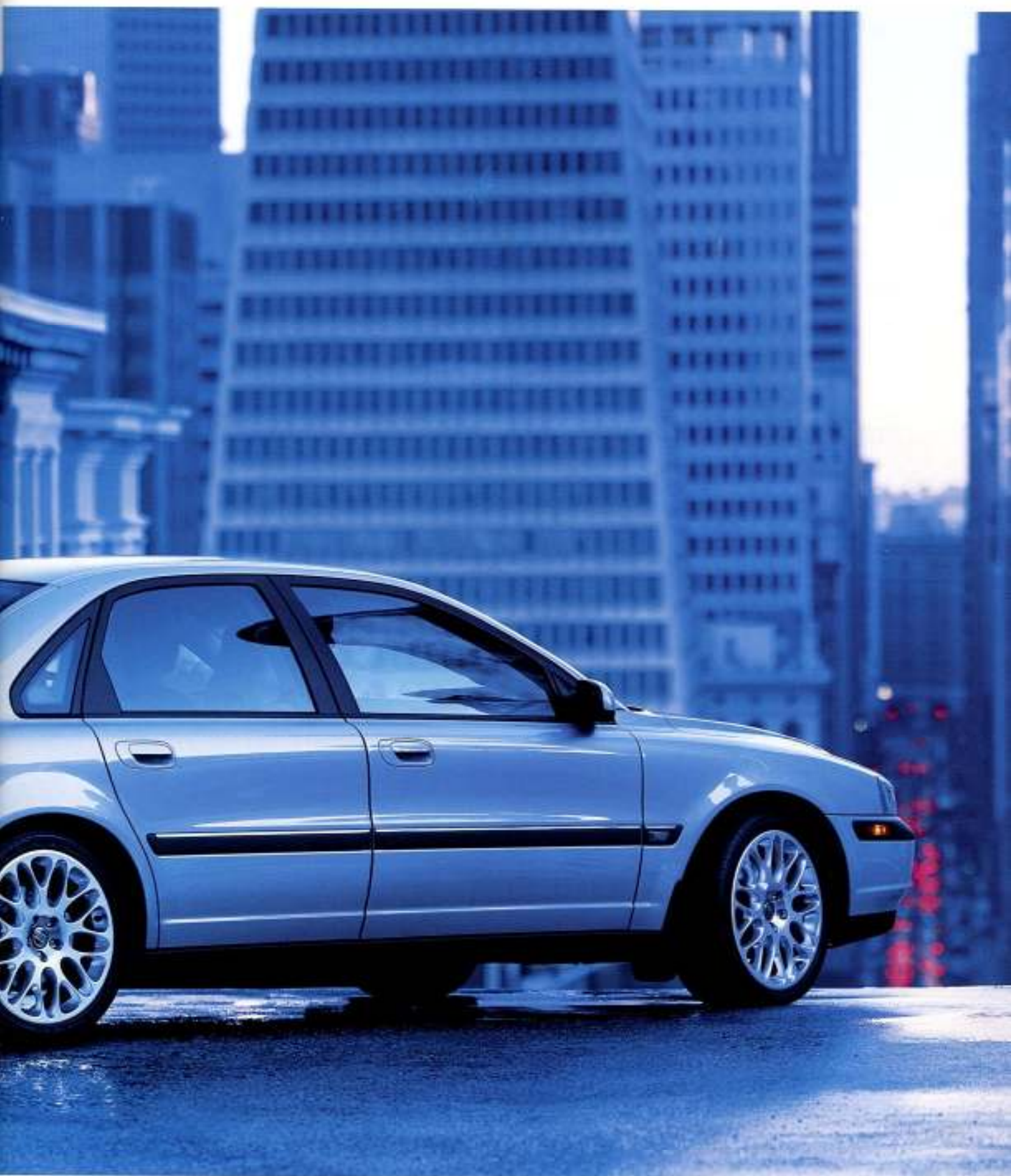
O Volvo S60 em Moondust metalizado com jantes em liga leve Capella 8x18".