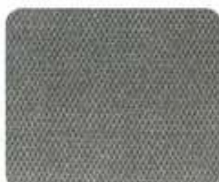
Sarek Plush Granito (8441)