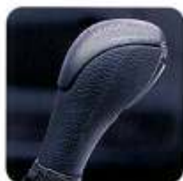
Manípulo da alavanca da caixa de velocidades com aplicações em alumínio Dynamic