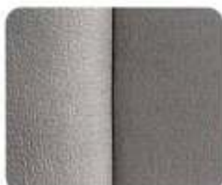
Tecido/Couro Wasa Granito (8341)