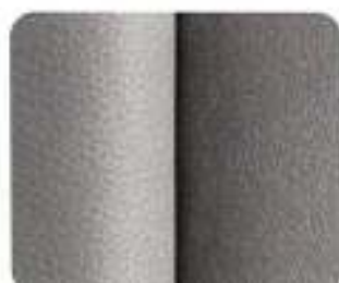
Bergen Alcantara*/Couro Granito (8841)