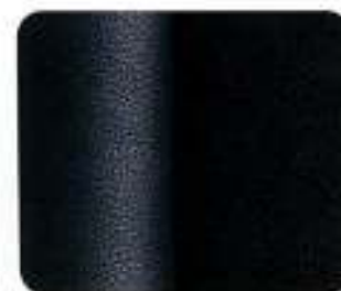
Bergen Alcantara*/Couro Preto (8870)