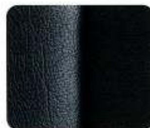
Tecido/couro Wasa Preto (8370)