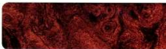
Aplicações tipo madeira Claret