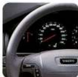
Volante em couro, Grafite