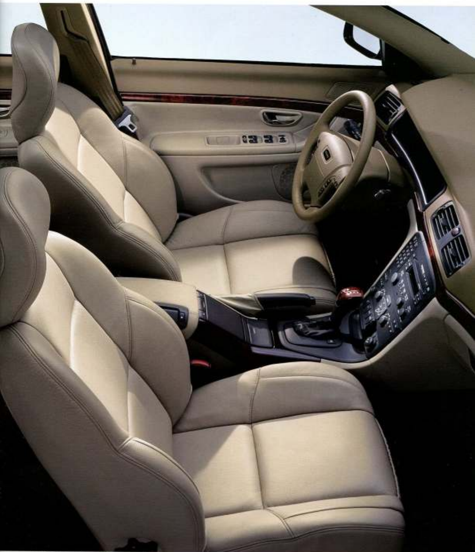
Estófos em couro desportivo Arena, com aplicações tipo madeira Claret, volante revestido a couro e manipulo da alavanca da caixa de velocidades com aplicações tipo madeira Claret.