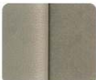
Bergen Alcantara*/Couro Arena (8891)