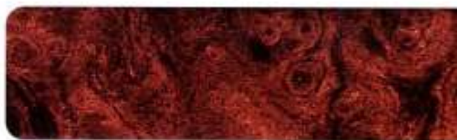
Aplicações tipo madeira Claret