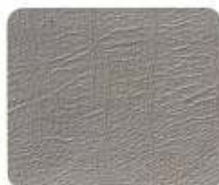
Couro desportivo Granito/Preto (8A79)