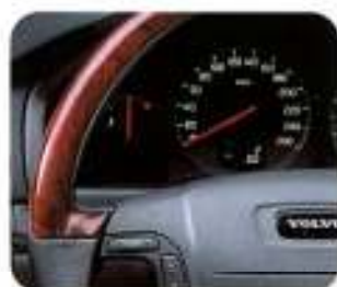
Volante em couro, Grafite com aplicações em noqueira