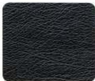
Couro Executive Preto (8E70)