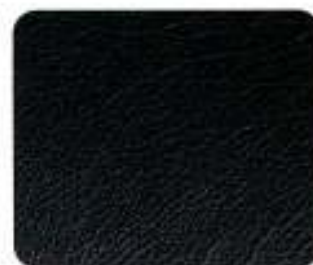
Couro Preto (8970)