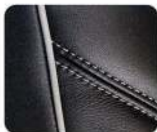
Couro macio Executive Preto (8F70)