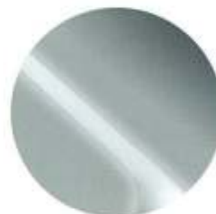
444 Polarctic Metalizado*