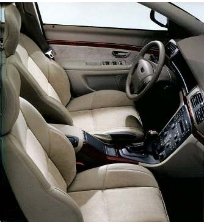
Interior Arena, estofos Bergen Alcantara 1/2 Couro, aplicações tipo madeira Claret, volante em couro Oak e manípulo da alavanca da caixa de velocidades com aplicações tipo madeira Claret.