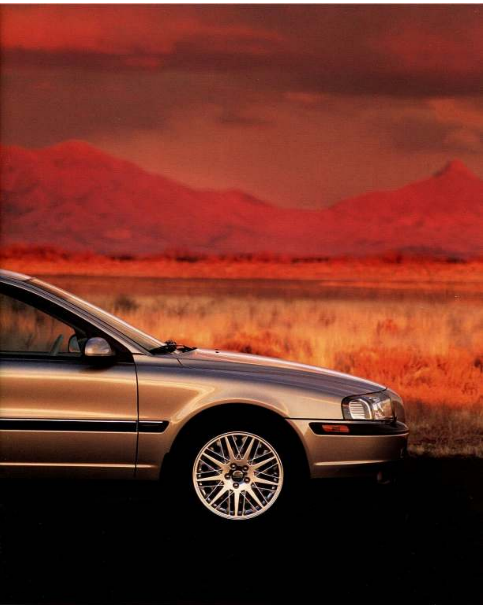
O Volvo S80 em Moondust metalizado com jantes em liga leve Arrakis 7x17".