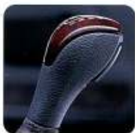
Manípulo da alavanca da caixa de velocidades com aplicações tipo madeira Claret