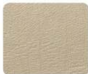
Couro desportivo Light Sand (8A5A)