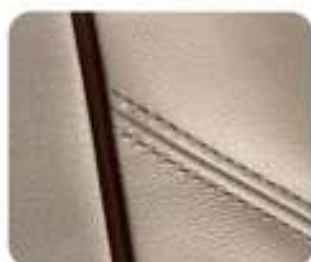
Couro macio Executive Arena (8F91)