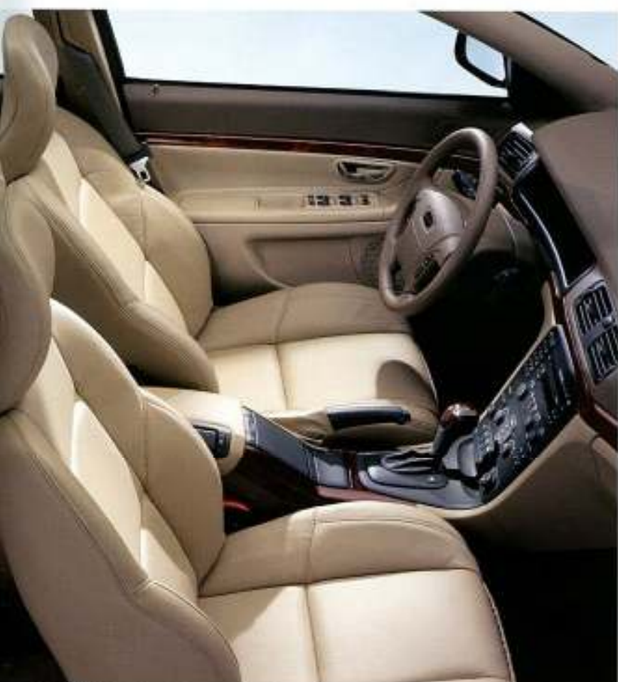
Interior Light Sand, estofos em couro desportivo, aplicações tipo madeira Claret, volante em couro com aplicações tipo madeira Claret e manipulo da alavanca da caixa de velocidades com aplicações tipo madeira Claret.