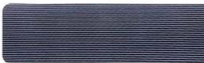
Aplicações em alumínio Dynamic