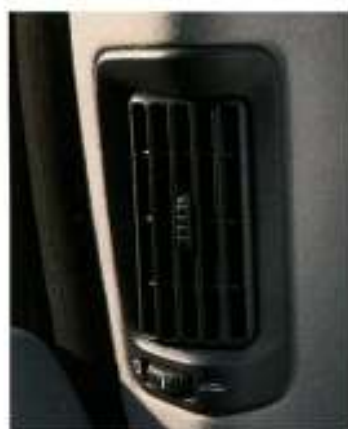
Entradas de ar separadas para o banco traseiro melhoram o conforto e ajudam a manter as janelas laterais desembaciadas.

Se necessitar de mais espaço de carga, basta rebater o banco traseiro - integral ou parcialmente. Pode ainda rebater o encosto do banco do passageiro da frente. Os objectos longos podem ser transportados na bagageira graças à existência de uma abertura no apoio de braços central do banco traseiro.