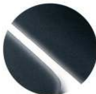
427 Cinzento Escuro Metalizado