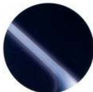
604 Azul Escuro*