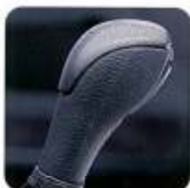
Manípulo da alavanca de velocidades com aplicações em alumínio Dynamic