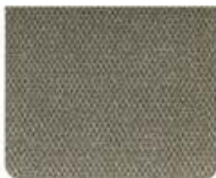
Sarek Plush Arena (8491)