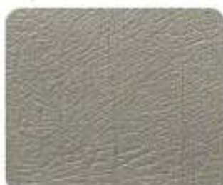
Couro desportivo Arena (8A91)