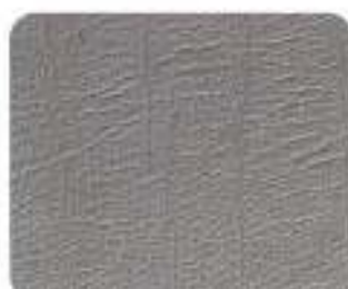
Couro desportivo Granito (8A41)