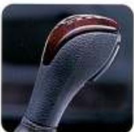
Manípulo da alavanca de velocidades com aplicações tipo madeira Claret