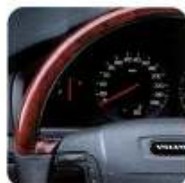
Volante em couro, Grafite com aplicações tipo madeira Claret