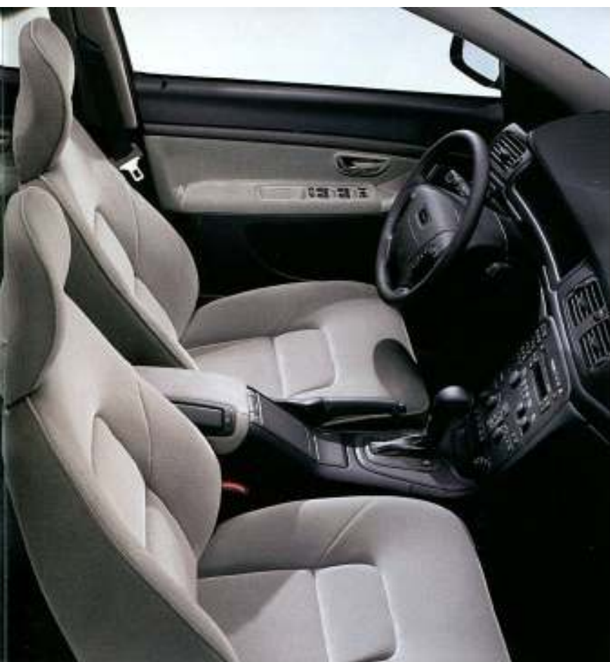
Interior Granito/Preto e estofos Sarek Plush.