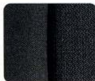
Tecido Birka Preto (8170)