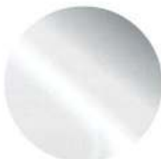
426 Cinzento Metalizado