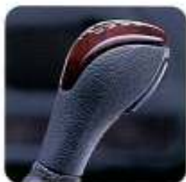
Manipulo da alavanca da caixa de velocidades com aplicações tipo madeira Claret