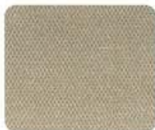
Sarek Plush Light Sand (845A)