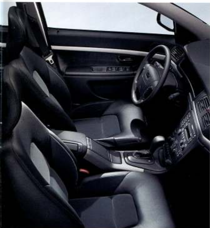
Interior Preto, estofos em tecido/couro Wassa, aplicações em alumínio Dynamic, volante em couro Grafite e manípulo da alavanca da caixa de velocidades com aplicações em alumínio Dynamic.