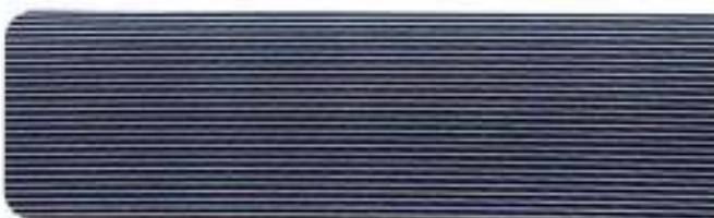
Aplicações em alumínio Dynamic