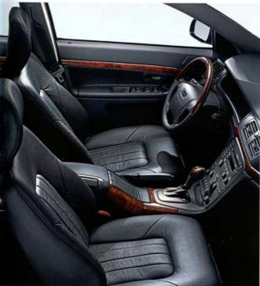
Estofos em couro Executive Preto, aplicações em noqueira no tablier, volante e manípulo da alavanca da caixa de velocidades.

Para além do completo equipamento de série, pode equipar o seu Volvo S80 Executive com uma variedade de opções exclusivas do modelo Executive. Adicionalmente, pode ainda acrescentar a maior parte das opções da gama Volvo standard.