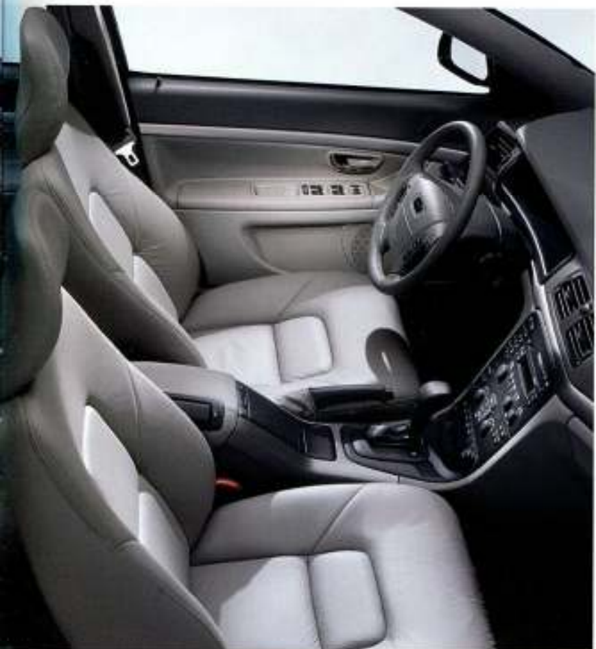
Interior Granito, estofos em couro, aplicações em alumínio Dynamic, volante em couro Granito e manípulo da alavanca da caixa de velocidades com aplicações em alumínio Dynamic.