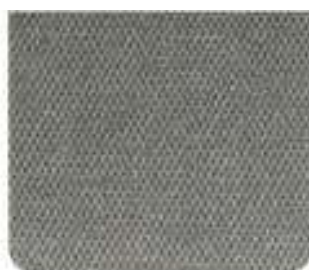
Sarek Plush Granito/Preto (8479)