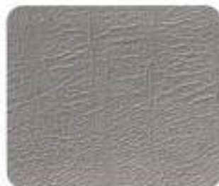
Couro Granito/Preto (8879)