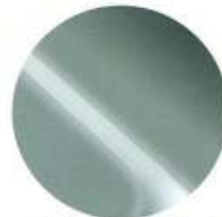
449 Verde Mistral Metalizado