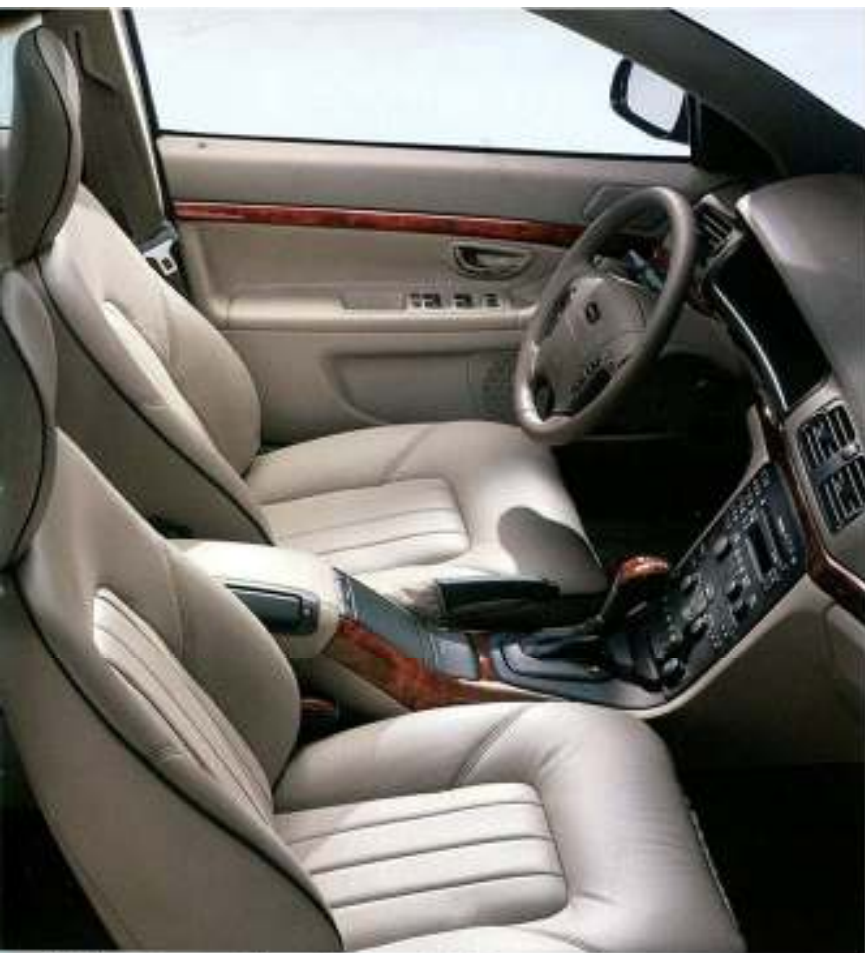
Estofos em couro macio Executive Arena, aplicações em noqueira no tablier e manípulo da alavanca da caixa de velocidades.