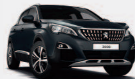
Серый Gris Hurricane