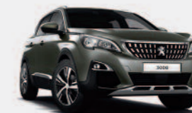
Серый Gris Amazonite