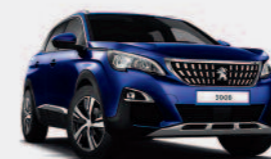
Синий Bleu Magnetic