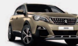
Бежевый Beige Pyrite