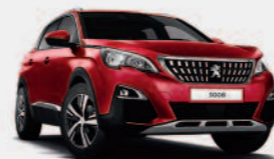
Красный Rouge Ultimate