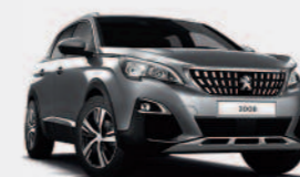
Серый Gris Artense