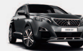
Серый Platinum Grey / черный Perla Nera