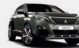
Серый Amazonite Grey / черный Perla Nera