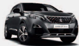
Серый Gris Platinum

Выберите один из одиннадцати цветовых вариантов тот, который будет соответствовать именно вашему темпераменту.