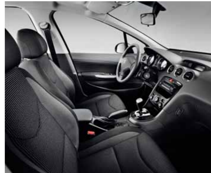
Allure – Strada