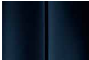
Темно-синий (Bleu Bourrasque)