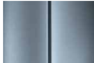
Серебристый (Gris Alu)