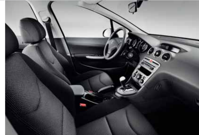
Active – Strada