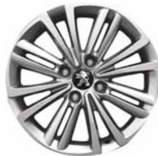
легкосплавные диски Sansiro 16" (Active, Allure)