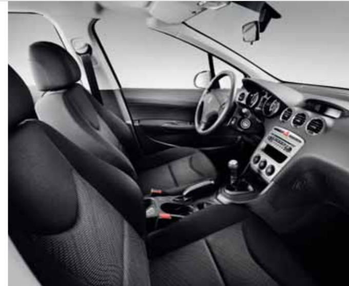
Access – Mistral Sibayak