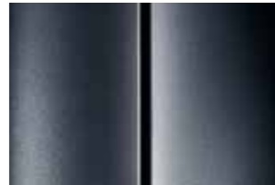
Серый (Gris Shark)