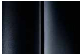
Черный (Noir Perla Nera)