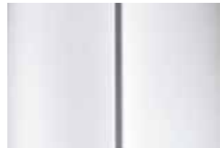
Белый (Blanc Banquise)