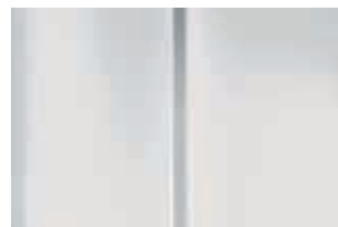
Белый (Blanc Vanquise)