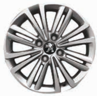
Легкосплавные диски Sansiro 16" (Active, Allure)