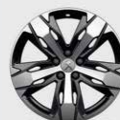
18-дюймовые легкосплавные колесные диски CHICAGO*, двухцветные со специальной обработкой поверхности для получения глянцевого покрытия