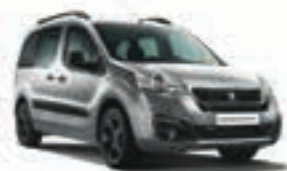
Серебристый металлик GRIS ALLUMINIUM ZRM0