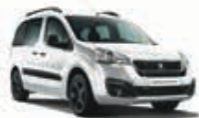
Белый акрил BLANC BANQUISE WPP0