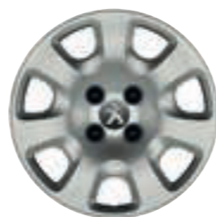
15" стальной диск