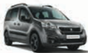
Серый металлик GRIS SHARK 9PM0