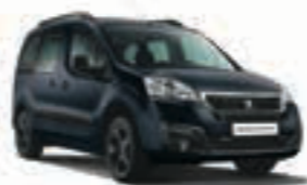
Синий металлик BLEU BOURRASQUE T4M0