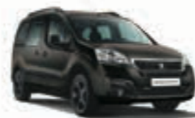
Коричневый металлик BROWN SQUIRELL JPM0