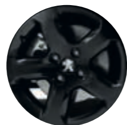
16" литой диск

PEUGEOT Partner Crossway оснащается штампованными дисками 15" или литыми 16", чтобы подчеркнуть его характер и индивидуальность.