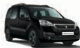
Черный металлик Noir Perla Nera 9VM0

Изображение автомобиля создано при определенных условиях. Цветовое восприятие изображений индивидуально и зависит от различных факторов, поэтому цвет автомобиля на изображении в данной брошюре может отличаться от цвета автомобиля Peugeot Partner Crossway, представленного в салоне официального дилера.