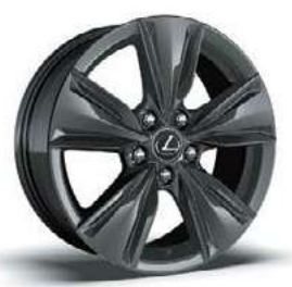
عجلات ألومنيوم مقاس ١٧ بوصة، معدني رمادي داكن