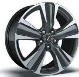
عجلات ألومنيوم مقاس ١٨ بوصة، معدني رمادي داكن