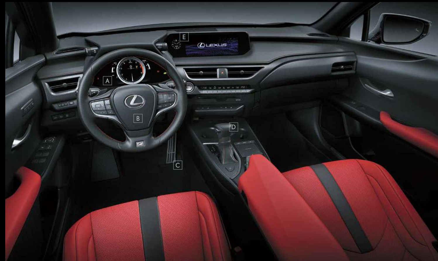
A_العدادات وشاشة عرض المعلومات المتعددة / B_عجلة القيادة / C_الدواسات الألمنيوم / D_مقبض ذراع ناقل الحركة / E_الساعة

حلقة العداد على لوحة عرض المعلومات المتعددة الملونة TFT (الترانزستورية الشريطية الرقيقة) الكبيرة تنزلق جانبياً بلمسة مفتاح على عجلة القيادة.