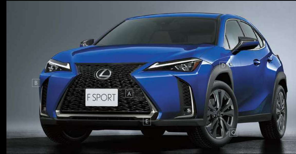
A_شبكة التهوية الأمامية المتشابكة / B_الصدام الأمامي / C_العجلات الألمنيوم / D_شعار الرفارف الأمامية

بناءً على حضور UX الآمن القوي، يتخذ F SPORT شكلاً عريضاً منخفضاً يوحي بالأداء الرياضي بلوحة خاطفة. وهو يتضمن خصائص تصميم F SPORT الحصرية التي تشمل شبكة تهوية الراديتز المتشابكة وحلية أسفل الصادمين الأمامي والخلفي وعجلات المنيوم مقاس ١٨ بوصة وألوان خارجية مختارة. ويتضمّن الإحساس بالطابع الرياضي في قمرة قيادة السائق بمقاعد الرياضية