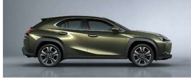
أخضر كاسي <6X4>