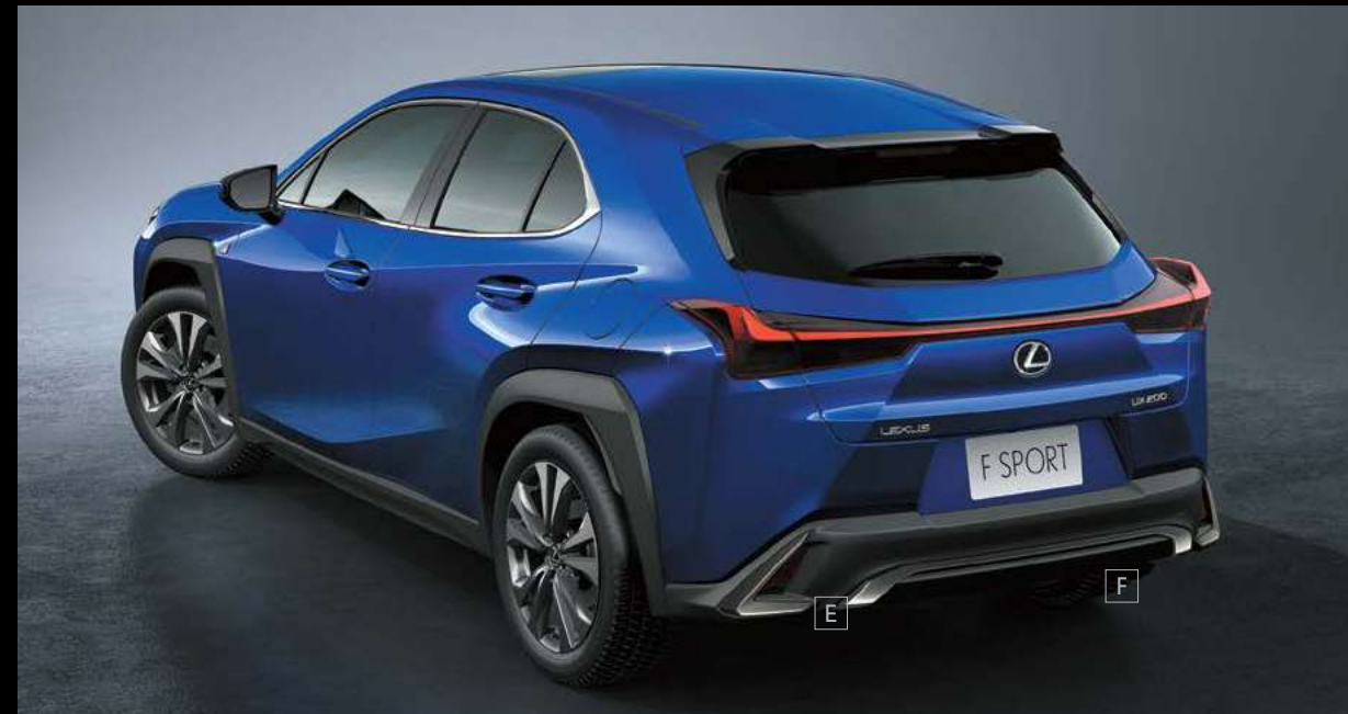
E_التصفيح بالواح سوداء حالكة / F_الصدام الخلفي