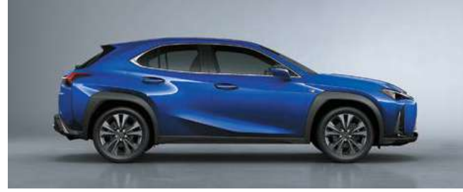
أزرق رياضي <8X1>*1