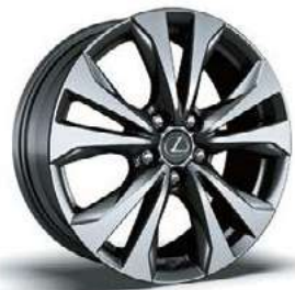
عجلات ألومنيوم مقاس ١٨ بوصة، معدني راق داكن (مجموعة تجهيزات F SPORT)