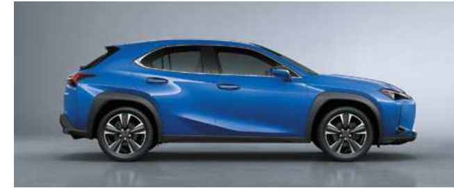
أزرق فلكي <8Y6>