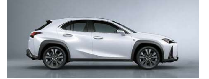
أبيض رياضي <083>*1