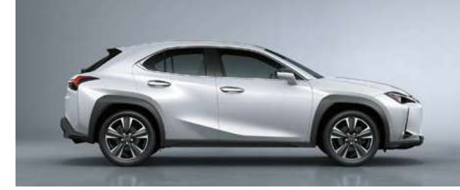
أبيض لؤلؤ <085>*2

تتمثل فكرة ألوان UX الرائعة في «المتانة مع الفخامة»، معبرة عن متانة سيارة الكروس أوفر وفخامة حبات نسيج Lexus المميزة. تشكيلة جديدة وعصرية من الألوان الخارجية والداخلية تتكامل مع حبات النسيج الفريدة من نوعها والجودة الراقية للتجديد ألواح الديكور.