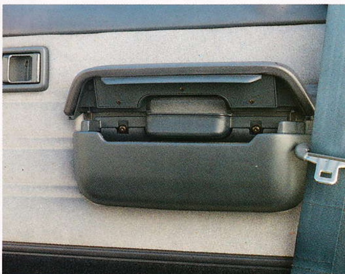
Praktiska förvaringsfack i dörrarna.