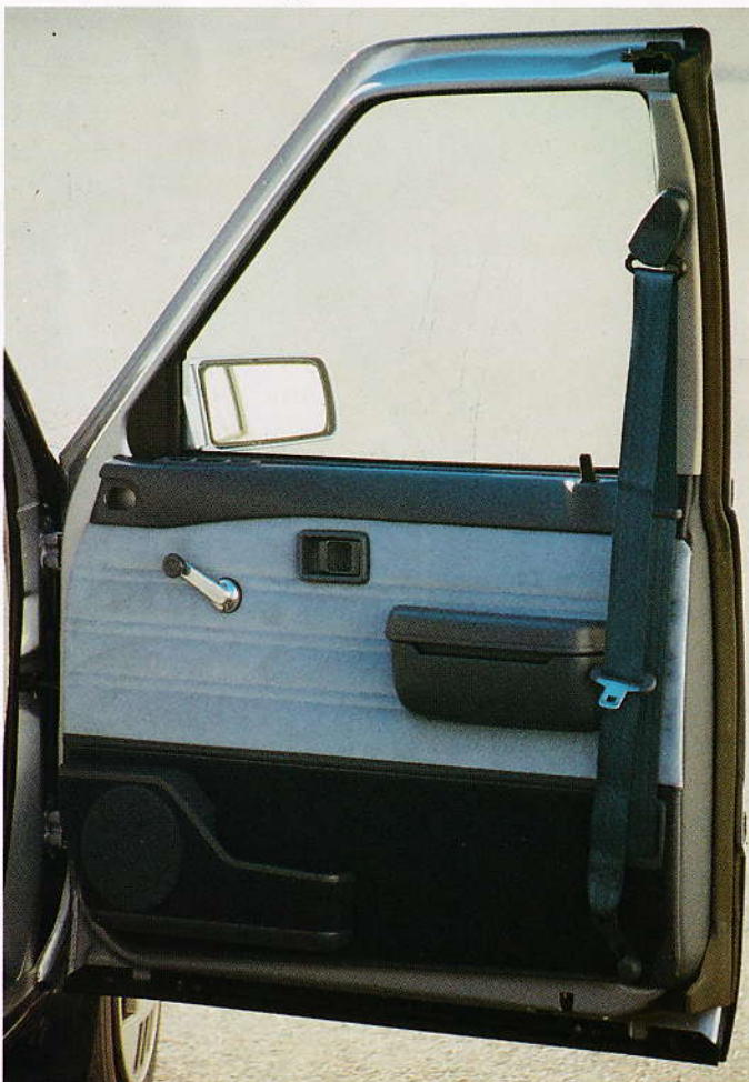
Framre bilbätna sitter direkt i dörrarna.