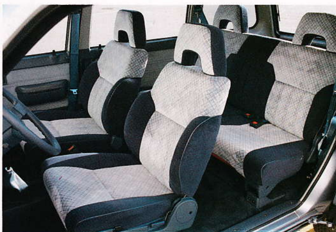
I Prairien åker du i First Comfort Class.