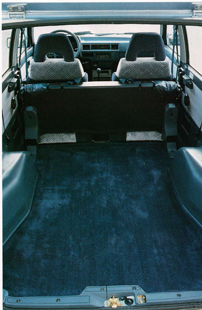
140 cm plant golv med fällt baksäte.

bara. Färger och material ger ett ombonat intryck. Ratten är förstås ställbar och instrumenten väl samlade. Alla årstider uppskattar du det effektiva värme- och ventilationssystemet. De eluppvärmda framstolarna i kombination med att bilen är bäddbar gör den idealisk som campingbil, där man får värme under kudden så att säga på köpet. I dörrarna finns flera praktiska förvaringsfack. En finess är att de främre bilbältena är direkt monterade i dörrarna. Alltså ännu enklare att komma in och ur rymdbilen.